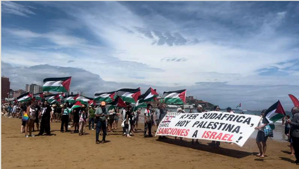
Alzando banderas por Palestina en San Lorenzo Xixón/ 20 julio