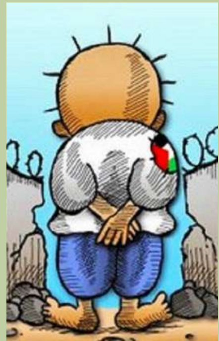
HANDALA. Naj al-Alí

-En Derechos de los Pueblos. (Con la nefasta decisión de la Axencia de eliminar la ponencia técnica de Derechos Indígenas, tras tenerla dos años paralizada).