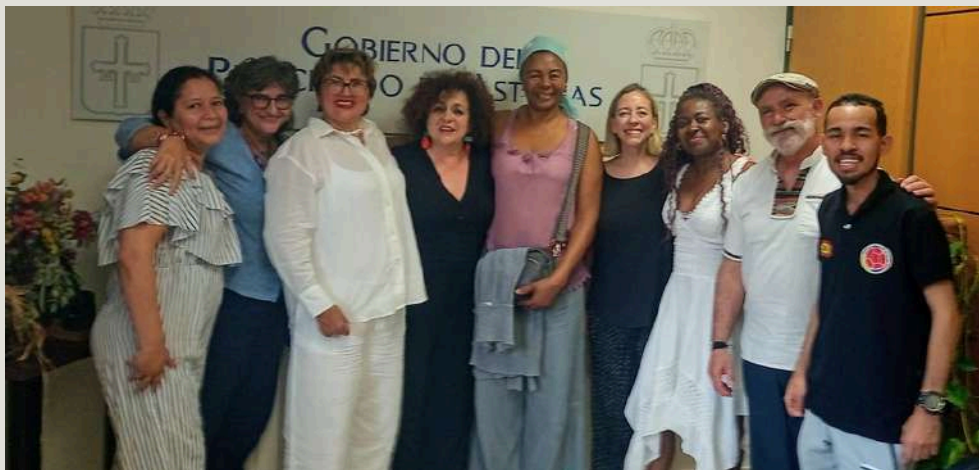
Grupo Acogido en el 2024

El PROGRAMA sigue siendo una respuesta solidaria y de referencia por su acción ininterrumpida, oportuna y humanista frente a los ataques contra la dirigencia social colombiana.