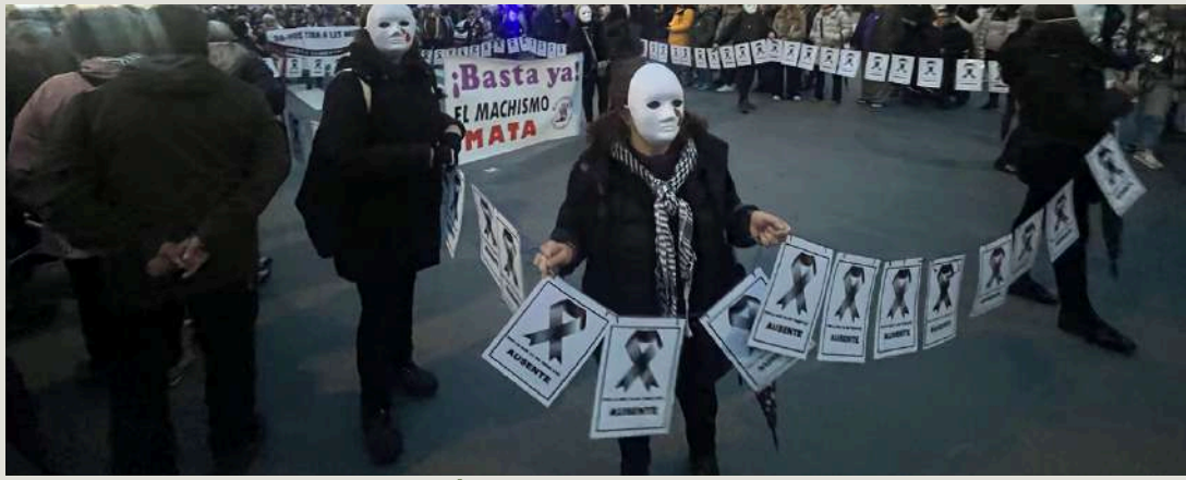
8M/ Sama de Llangreu