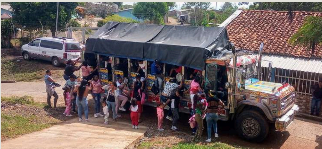
Buenos Aires, Cauca, Colombia

Incluso en los territorios con pactos de cese al fuego bilateral se siguió atacando a los civiles, confinando o desplazando poblaciones y asesinando a la dirigencia local.