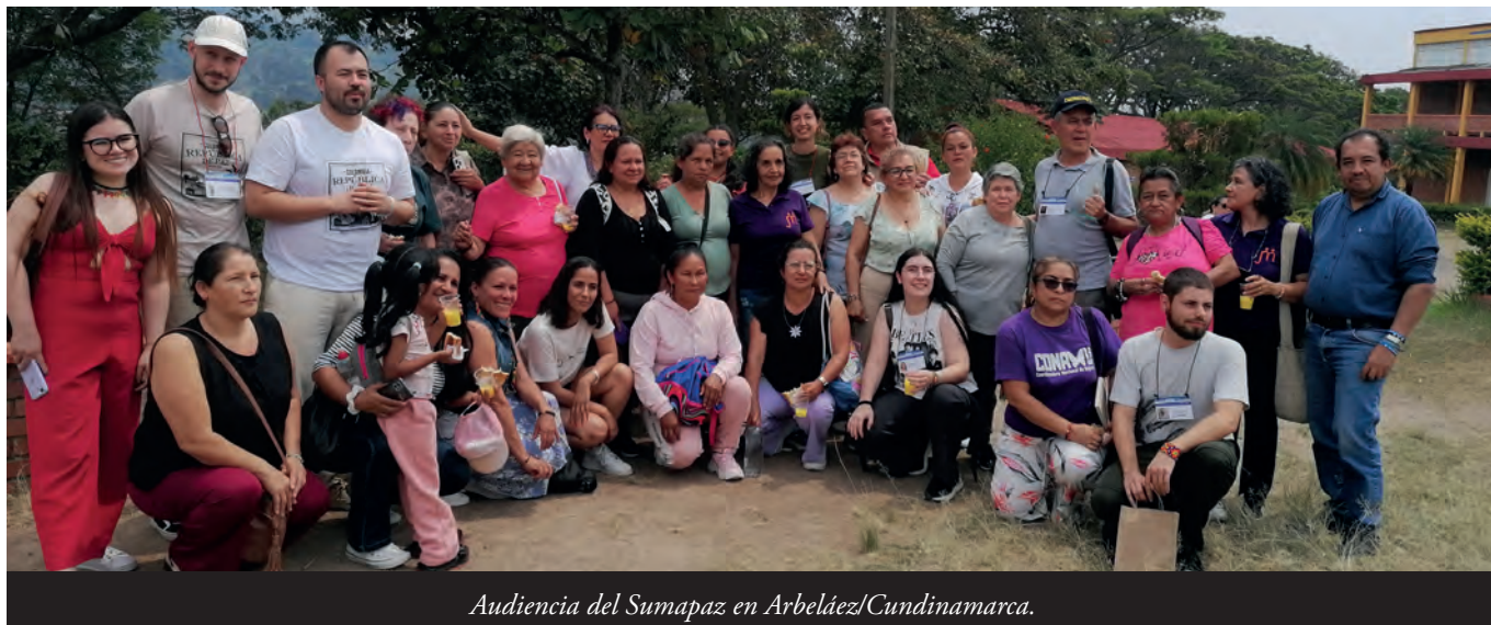
Audiencia del Sumapaz en Arbeláez/Cundinamarca.

población civil como los asesinatos contra la dirigencia social y los firmantes de la paz, sumándose a las violencias históricas originadas en el racismo, el clasismo y el patriarcado.