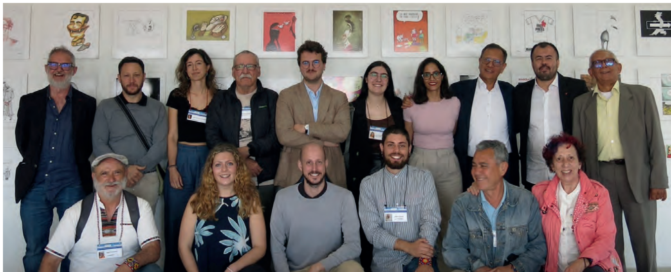
Con el Colectivo de Abogados José Alvear Restrepo en Bogotá.

El ex Secretariado de las Farc considera que la JEP se aleja de lo acordado y genera inestabilidad jurídica lo que ha llevado a que “...varios firmantes de paz regresen a las armas, junto a disidencias y grupos delincuenciales... La JEP se ha excedido en el número de macro casos, se acerca al ‘punitivismo’ y el Estado no ha reconocido responsabilidades... A pesar de nuestro cumplimiento con relación a la jurisdicción nos preocupa el empeño de la JEP por alejarse del espíritu y la letra de lo acordado, haciendo sus propias interpretaciones a un texto que es claro en sus propósitos de paz, dado el carácter político del Acuerdo que firmamos con el Estado, pretendiendo llevarlo un terreno judicial punitivista, más propio de un sometimiento a la justicia lo cual es contrario a la idea de centrar el esfuerzo en los casos más representativos que constituyen patrones de conductas violatorias del DIH y los Derechos Humanos, lo que ha disparado las alarmas frente a la seguridad jurídica del conjunto de firmantes del Acuerdo, provocando desconfianza en los mismos, lo que se traduce en la decisión de apartarse de los compromisos del Acuerdo, tal como lo evidencian las cifras actuales de la Agencia para la Reincorporación