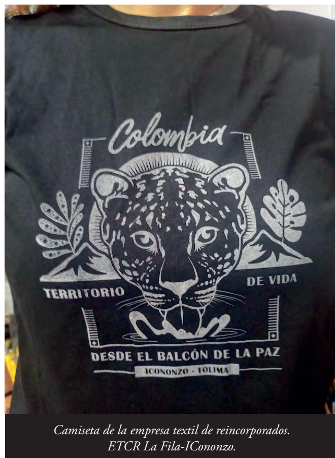
Camiseta de la empresa textil de reincorporados. ETCR La Fila-Icononzo.

da, amenazada y obstaculizada en su labor organizativa por integrantes del Estado Mayor Central que busca controlarnos. En el departamento del Caquetá hay una guerra contra las organizaciones y los procesos sociales. El EMC-FARC envió cartas con amenazas contra COORDOSAC, las cooperativas y ASOJUNTAS, con el propósito de controlarnos mediante el miedo. Estamos al límite con tantas amenazas de muerte en las que se quiere obligar al campesinado a afiliarse a una organización controlada por el grupo armado.” 55