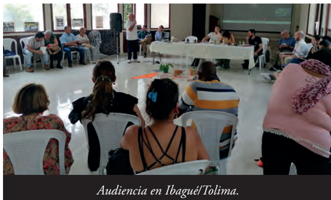
Audiencia en Ibagué/Tolima.

“El asentamiento La Esperanza ubicado en Pradera tiene tres resguardos indígenas y vive la violencia desde 1984.”