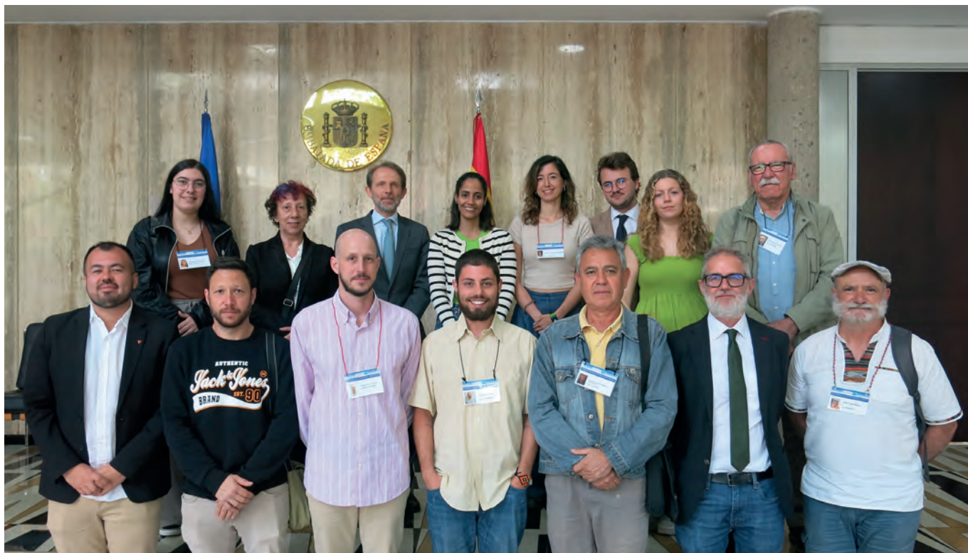
La XX Delegación Asturiana con el Sr. Embajador de España en Colombia.

“Hay una crisis de los derechos humanos y el peligro de que se enraíce nuevamente la violencia en muchas regiones para desestabilizar al gobierno del cambio. Es un momento de crisis del proyecto de paz total del gobierno.”