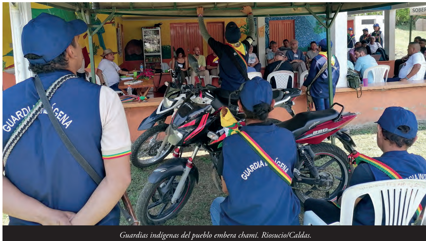
Guardias indígenas del pueblo embera chamí. Riosucio/Caldas.