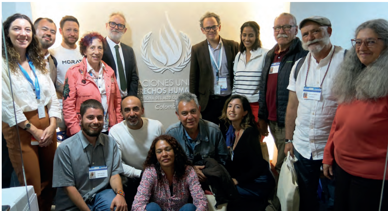
Reunión con la oficina de la ONU en Colombia.

“Las FARC nos construyó una escuela, el gobierno nos la bombardeó. Las FARC nos construyó un hospital, el gobierno nos lo desmanteló. En ese tiempo en las FARC había con quien hablar.” 81