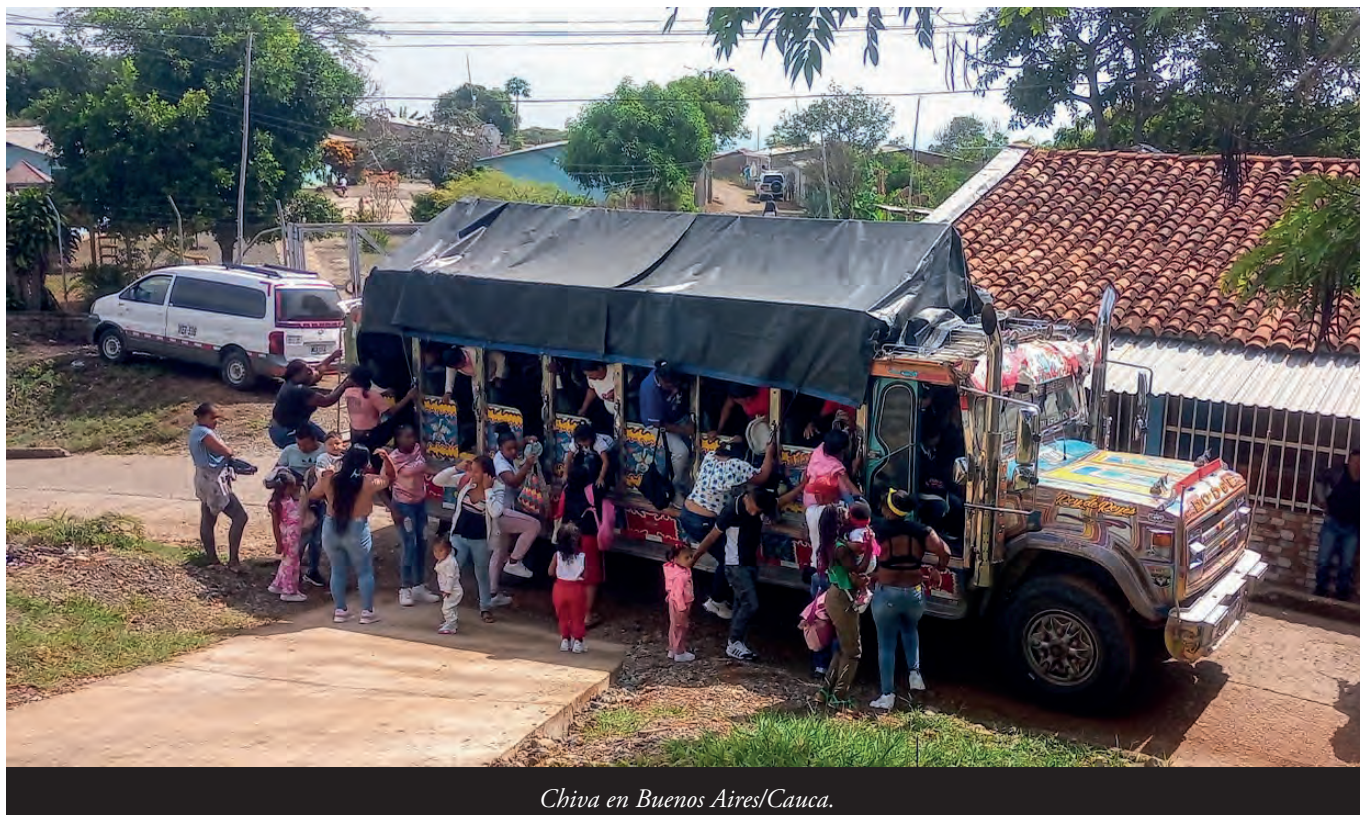
Chiva en Buenos Aires/Cauca.

interseccional, étnico y antirracista, como respuesta al llamado del Consejo de Seguridad que en el año 2000 abordó el trato desigual y desproporcionado a las mujeres y niñas en los conflictos armados. 43