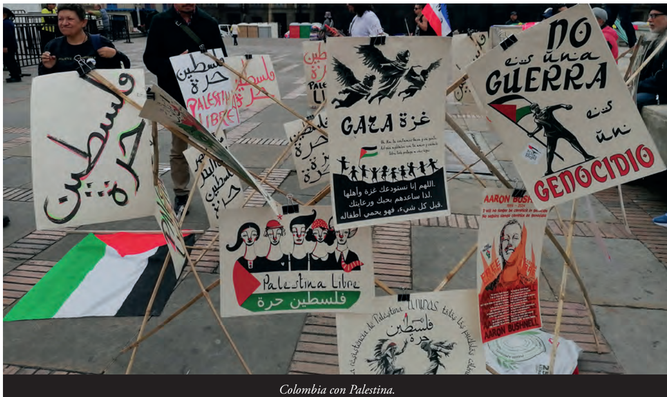
Colombia con Palestina.

ral, además porque las autoridades sólo entienden la seguridad como la militarización de la vida civil y del territorio y eso va a agravar las cosas, eso ya lo vivimos medio siglo y no resolvió el problema. Ibagué es una ciudad llena de injusticias, de inequidad, en la que la miseria se ve en las calles y cada día llegan familias campesinas desplazadas y la administración no atiende el problema social que crece.” 100