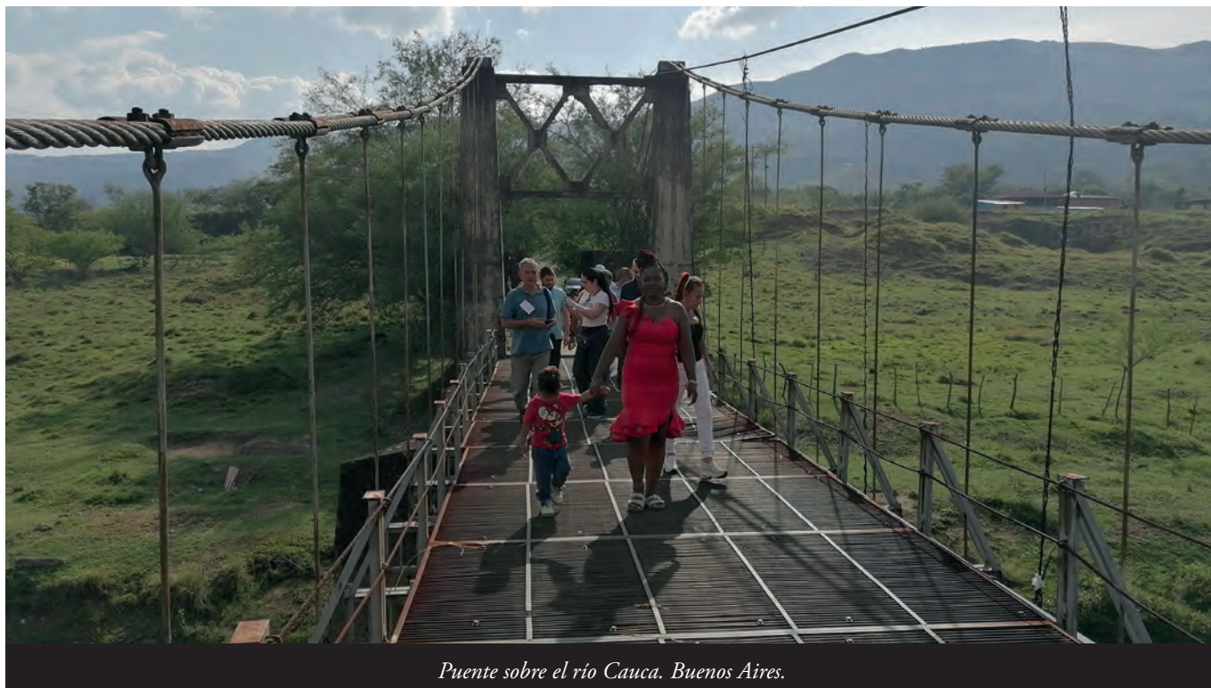
Puente sobre el río Cauca. Buenos Aires.

de personas estigmatizadas socialmente y la mal denominada 'limpieza social'. " 58