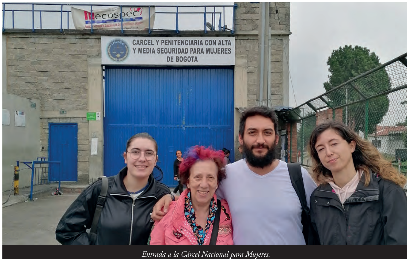
Entrada a la Cárcel Nacional para Mujeres.

detención por meses de al menos 23 mil personas reclusas en Centros de Detención Transitoria, estaciones de policía y Unidades de Reacción Inmediata. 128