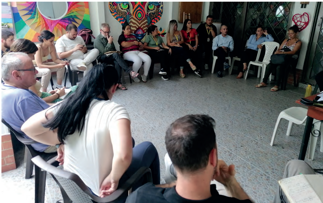
Reunión con instituciones en Ibagué/Tolima.

los Caciques Paramilitares, La Oficina de Armenia y otros grupos cuya existencia es negada por el gobierno departamental. 87