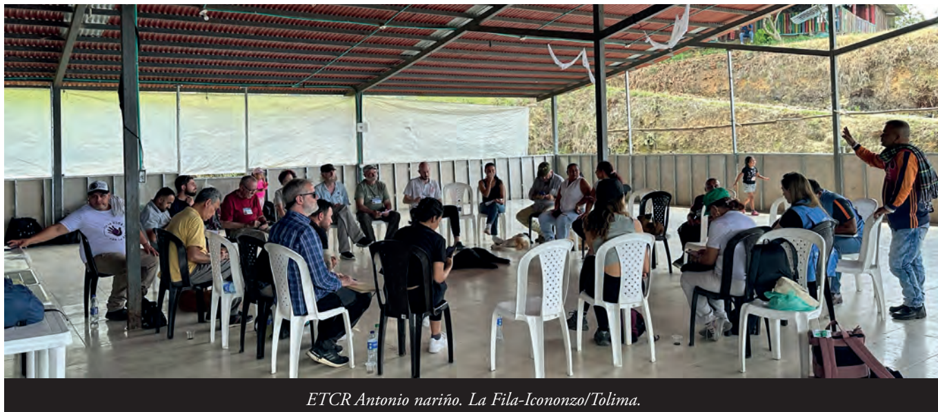
ETCR Antonio nariño. La Fila-Icononzo/Tolima.

si se espera el deslinde del paramilitarismo, de lo contrario, de no verse hechos reales, ¿de qué paz total nos habla? ¿O solo buscan el desarme del ELN para que después nos acribillen, como viene sucediendo con los excombatientes de la exfarc?” 23