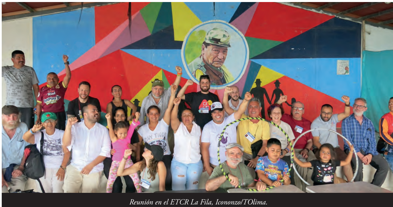
Reunión en el ETCR La Fila, Icononzo/Tolima.

“La personería municipal no puede investigar ni sancionar a los miembros de la fuerza pública que no cumplen con su deber, porque la competencia la tiene el orden nacional.” 111