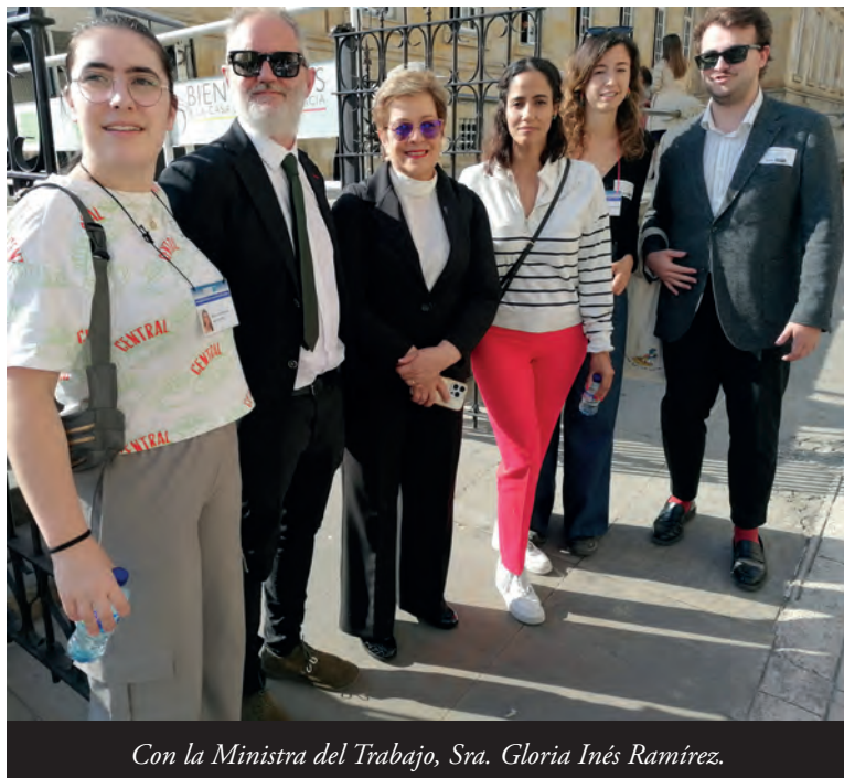
Con la Ministra del Trabajo, Sra. Gloria Inés Ramírez.

“La historia de la violencia contra nosotros es vieja. Pasamos de ser sujetos culturales a sujetos políticos con la ley 89 de 1890 del Congreso de Colombia “Por la cual se determina la manera como deben ser gobernados los salvajes que vayan reduciéndose a la vida civilizada”. “Aquí le cortaban la lengua a los indios que se negaron a hablar el español. En estos días hay señalamientos falsos que suelen salir antes de agredirnos, como decir que la Guardia Indígena es la milicia de las FARC.” 90