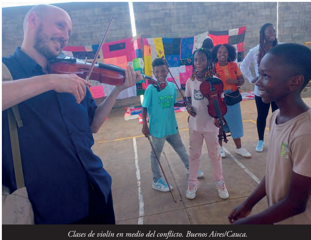
Clases de violín en medio del conflicto. Buenos Aires/Cauca.

En las cárceles persiste el estado de cosas inconstitucional, con graves afectaciones para miles de personas recluidas.