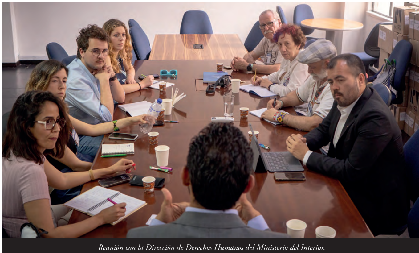
Reunión con la Dirección de Derechos Humanos del Ministerio del Interior.