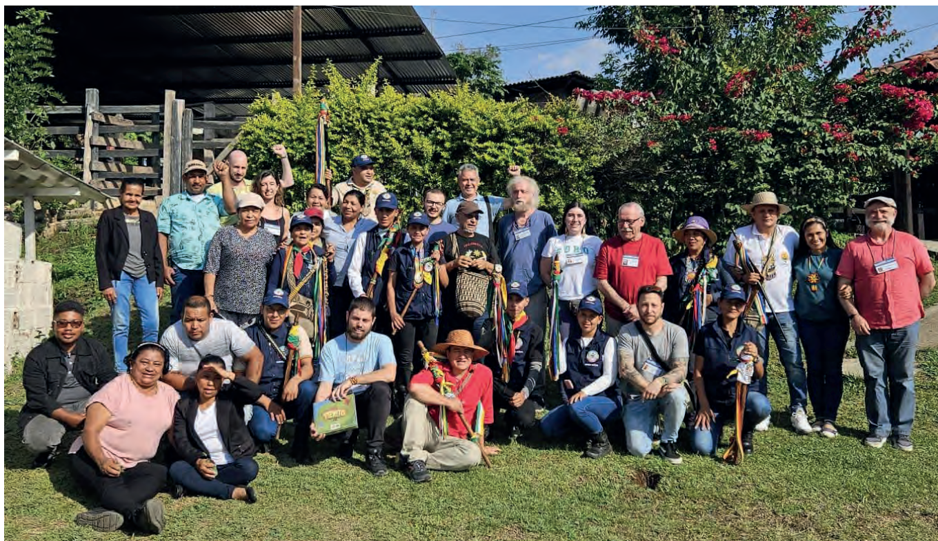
Audiencia con el pueblo indígena embera chamí de Riosucio/Caldas.