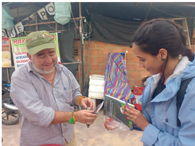
La cultura presente en el ETCR La Fila, Icononzo/Tolima.

amenazas, 33 retenciones, 30 hostigamientos y combates, 26 atentados, hallazgos de 19 artefactos explosivos, 12 desplazamientos, 7 masacres, 6 personas fueron desaparecidas, 4 fueron secuestradas, 3 comunidades fueron confinadas. 62