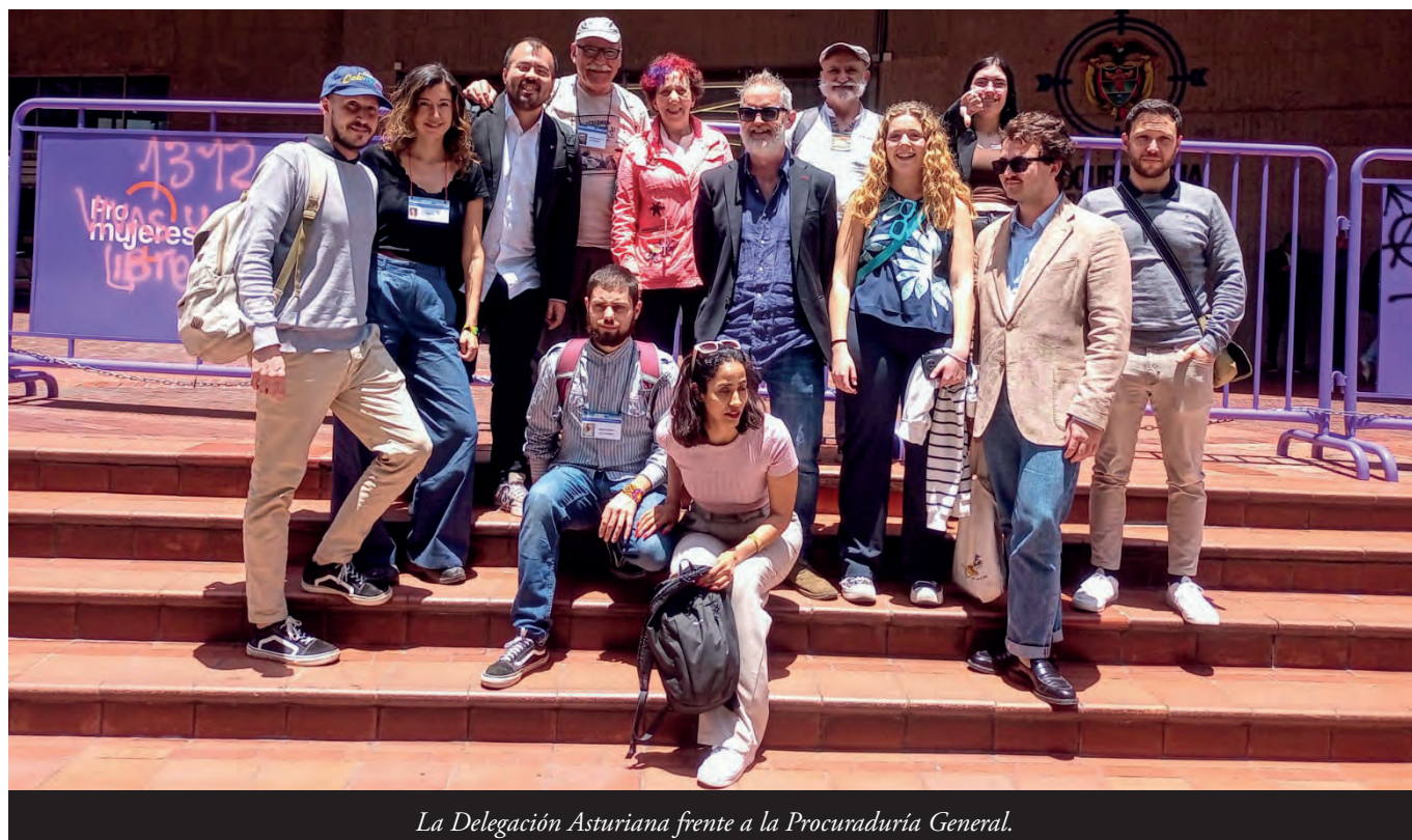
La Delegación Asturiana frente a la Procuraduría General.

https://movimientodevictimas.org/la-delegacion-asturiana-de-derechos-humanos-y-paz-en-colombia-acompano-la-audiencia-internacional-estado-de-derechos-humanos-y-de-la-paz-en-tolima/ https://movimientodevictimas.org/el-capitulo-caldas-recibio-a-la-xx-delegacion-asturiana-de-derechos-humanos-y-paz-en-colombia/ https://semanariovoz.com/delegacion-asturiana-verifico-situacion-de-derechos-humanos/ https://www.facebook.com/periodico.arbelaez/ https://pachakuti.org/vigesina-delegacion-astur-a-colombia/ https://www.codopa.org/xx-delegacion-ddhh-colombia https://www.nortes.me/2024/04/11/la-delegacion-asturiana-de-derechos-humanos-ya-esta-en-colombia/