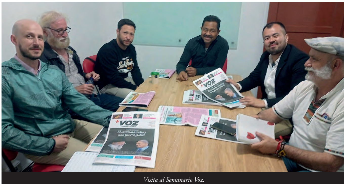
Visita al Semanario Voz.