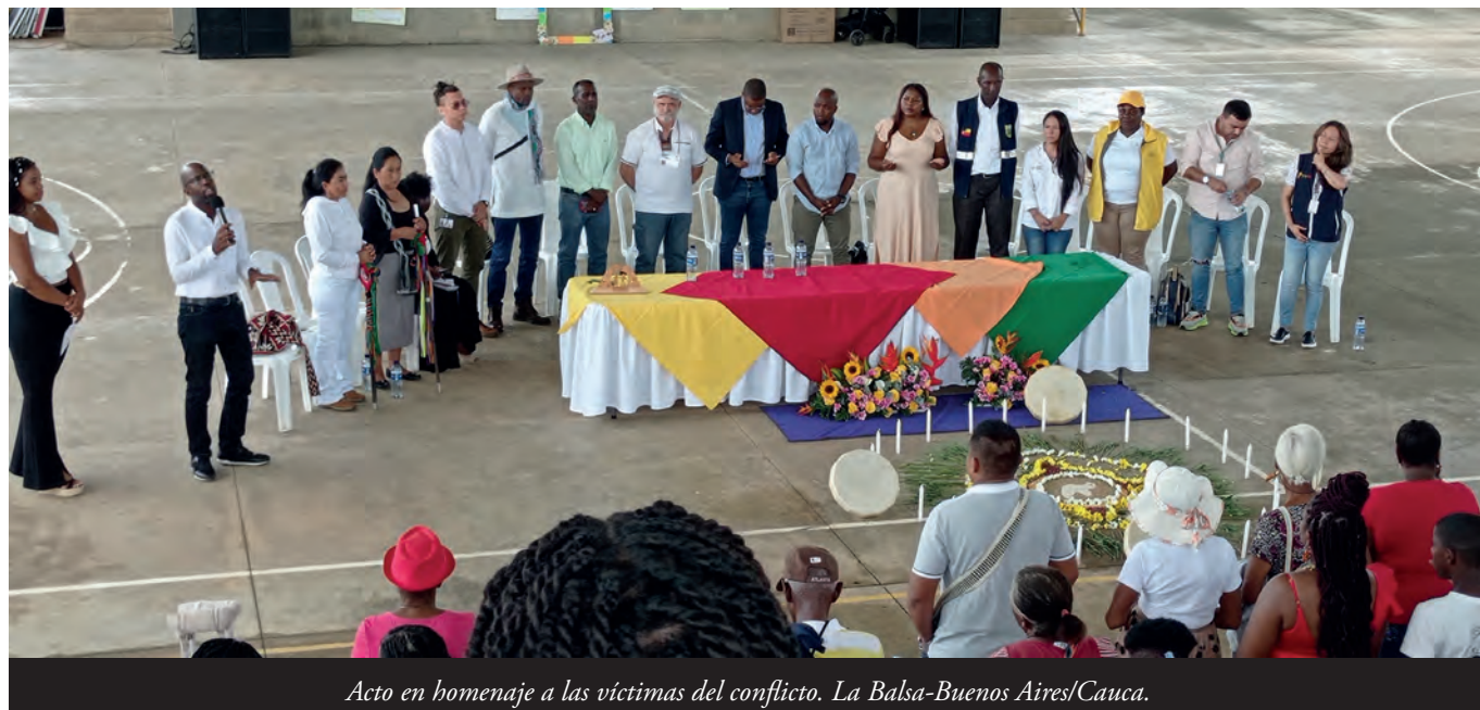
Acto en homenaje a las víctimas del conflicto. La Balsa-Buenos Aires/Cauca.