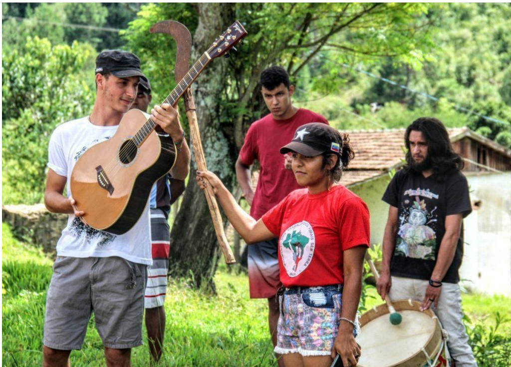
Juventud del MST- la cultura y el arte como herramientas de lucha por la reforma agraria.