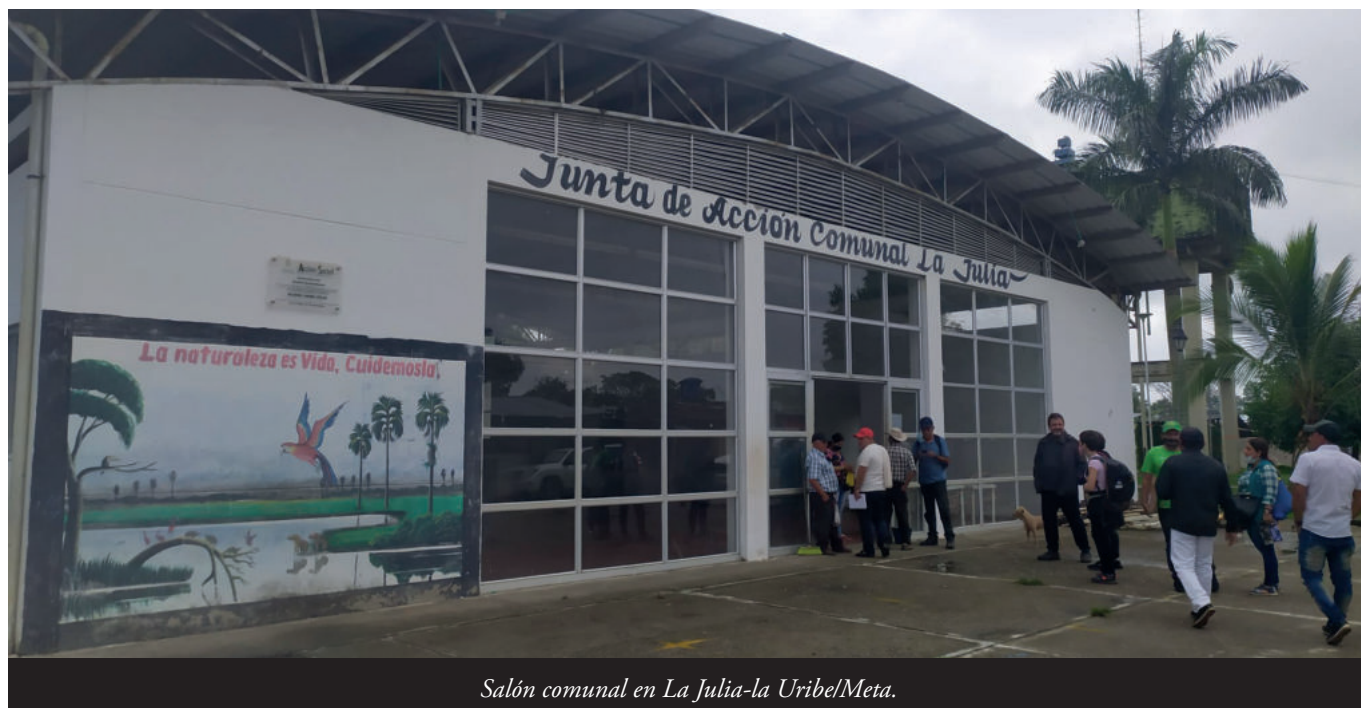
Salón comunal en La Julia-la Uribe/Meta.