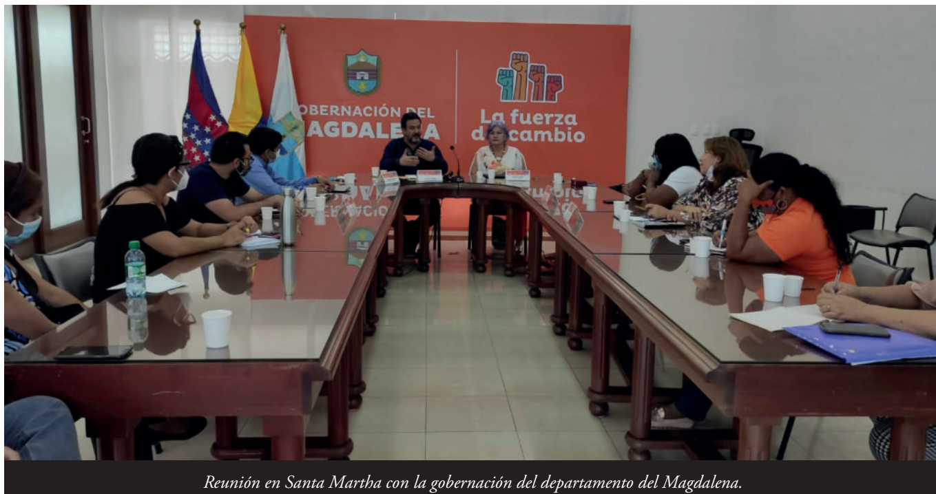
Reunión en Santa Martha con la gobernación del departamento del Magdalena.

chos humanos, los treslaos, los homicidios colectivos, conocíos comúnmente como masacres, toos s'alluguen nes mesmes zones xeográfiques de Colombia y concasen coles rutes de narcotráficu y les zones d'extracción ilegal de minerales” 63 .