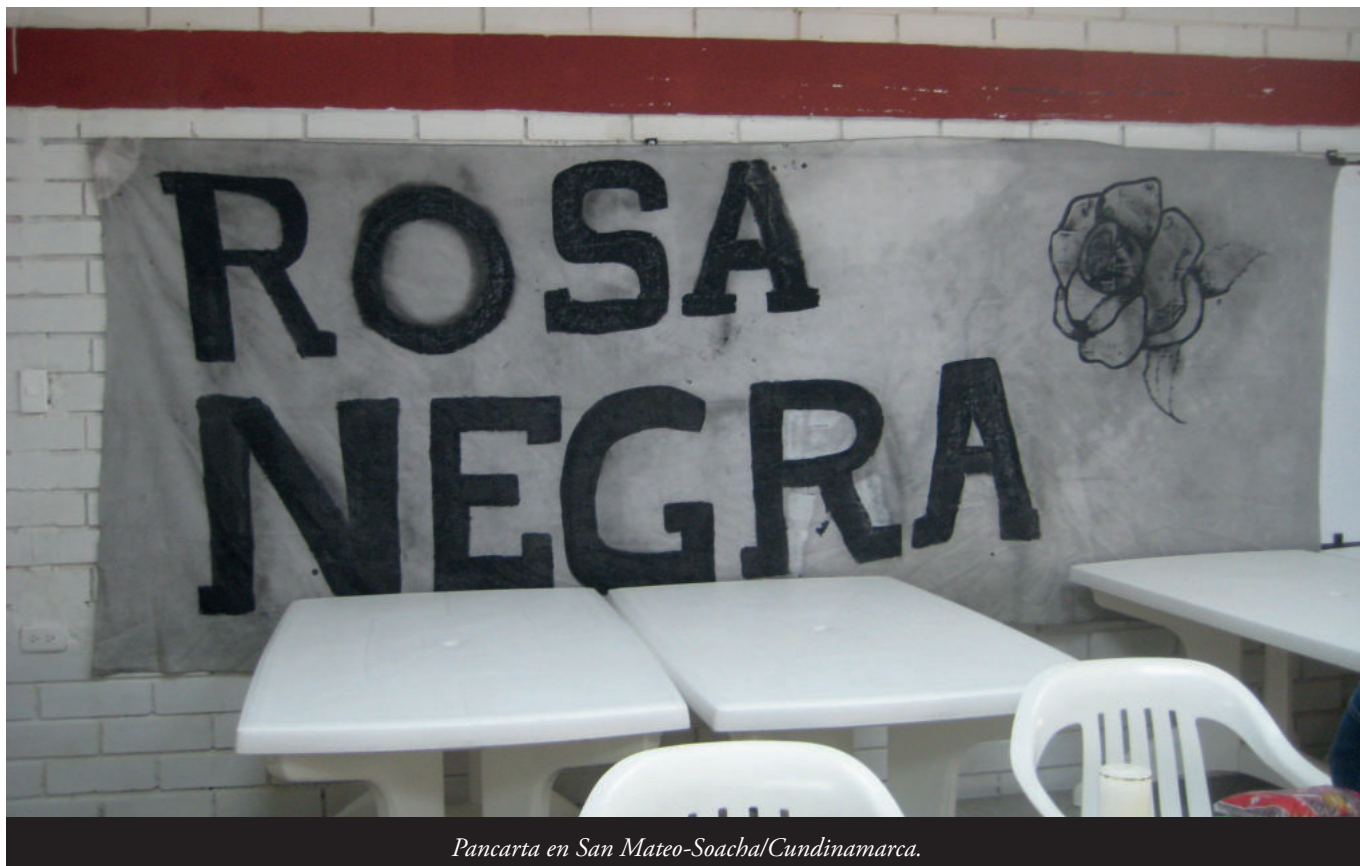
Pancarta en San Mateo-Soacha/Cundinamarca.