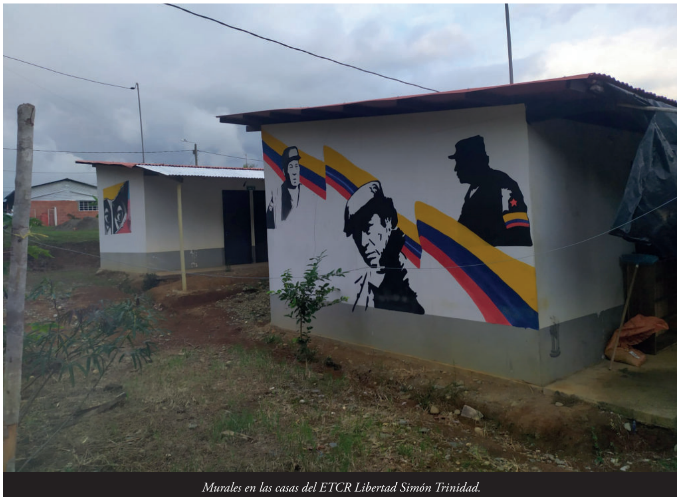
Murales en las casas del ETCR Libertad Simón Trinidad.