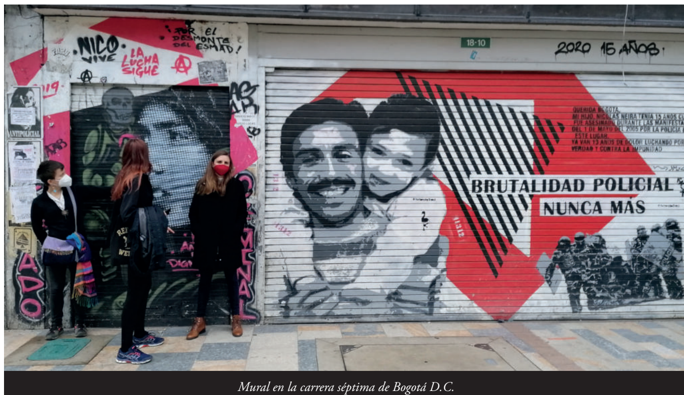
Mural en la carrera séptima de Bogotá D.C.