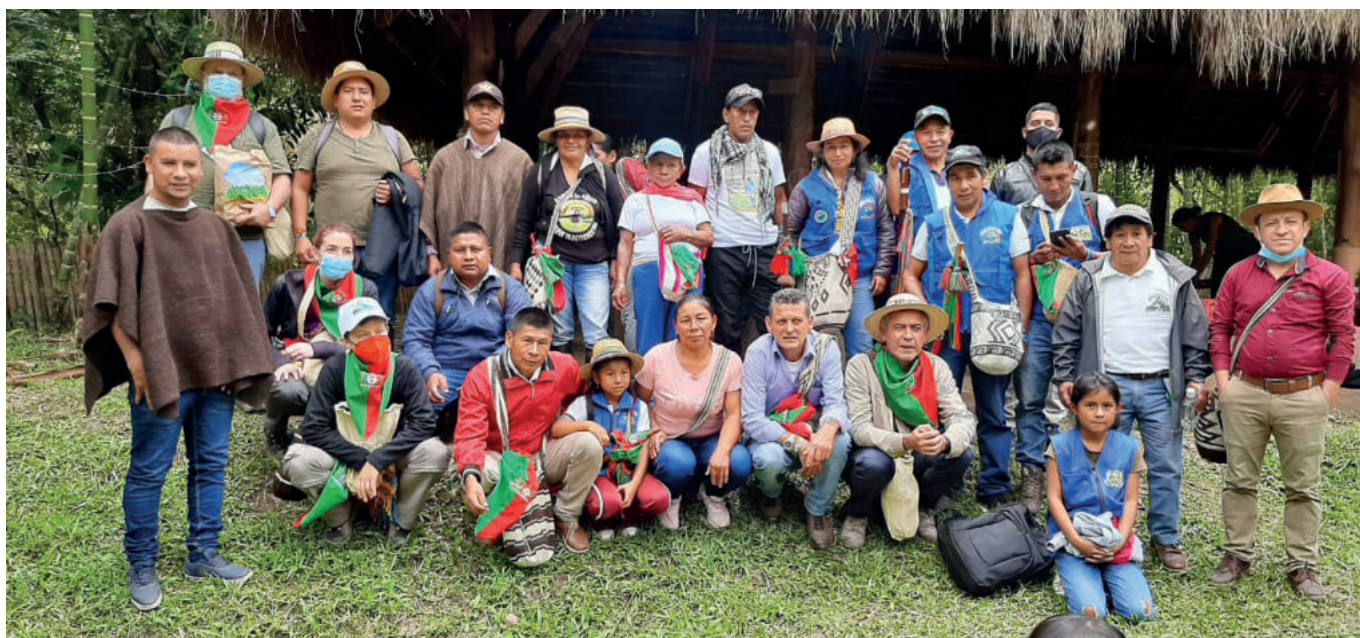
La Delegación Asturiana con autoridades y comuneros-as del pueblo nasa. Resguardo de San Francisco, Toribío/Cauca.