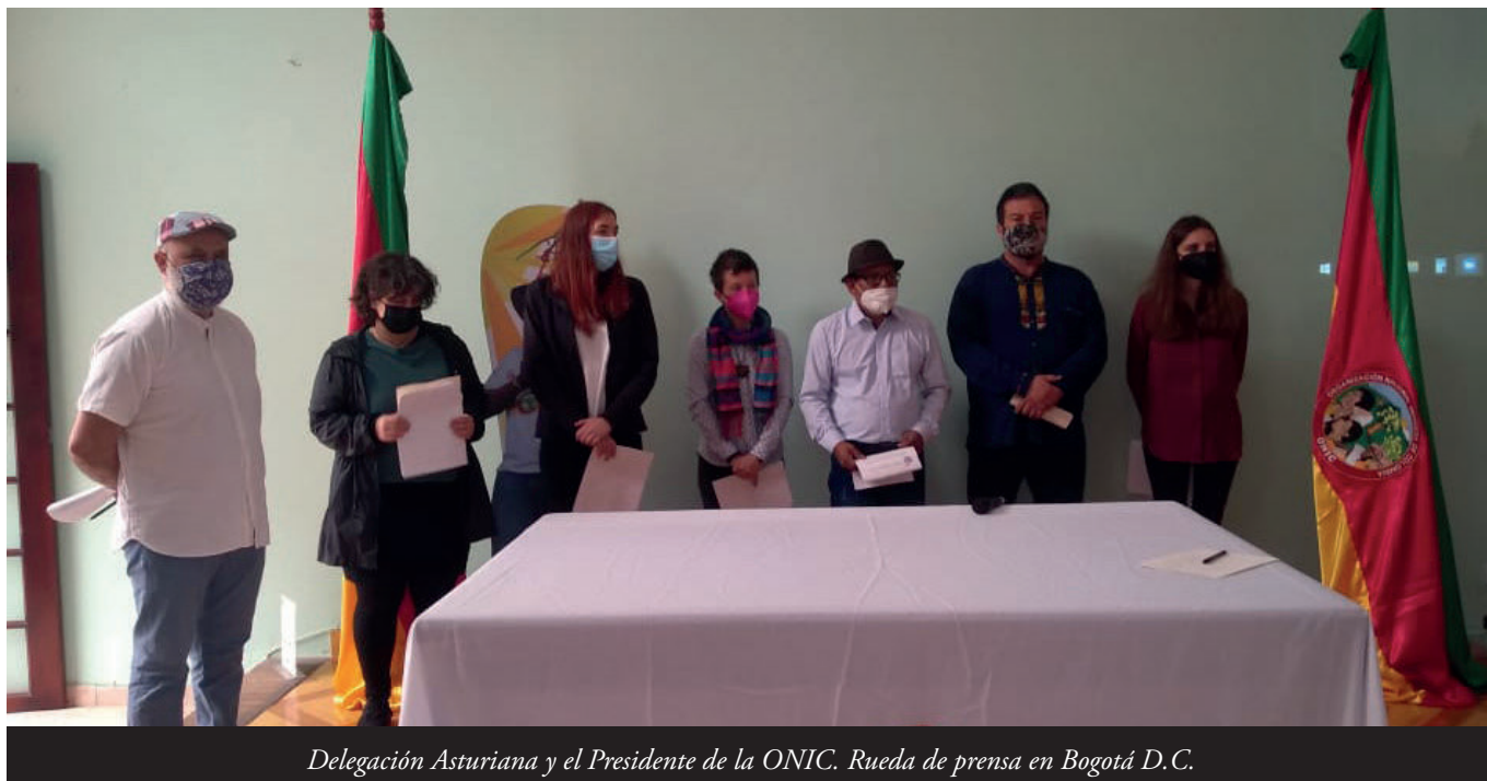
Delegación Asturiana y el Presidente de la ONIC. Rueda de prensa en Bogotá D.C.

llugamientu pue ser a un llugar igual o peor que'l que dexen" 59 .