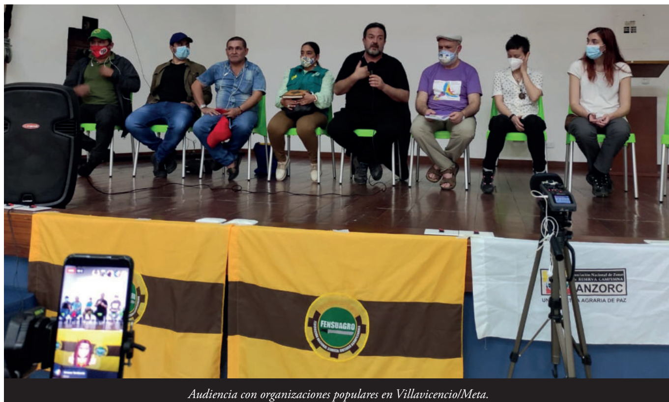
Audiencia con organizaciones populares en Villavicencio/Meta.

adicionales dirixéronse escontra la guardia indíxena, como actor más visible del control territorial.” 35