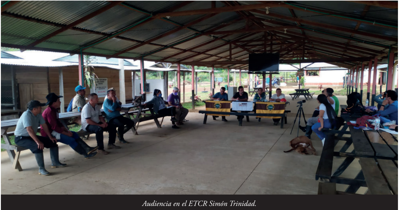
Audiencia en el ETCR Simón Trinidad.

conciene a la República de Cuba, nación que ta siendo inxustamente atacada por cuenta de la so coherencia y compromisu cola paz de Colombia. Apoyu que reconoció vusté, Sr. Secretariu Xeneral, como lo espresó'l so voceru, el Sr. Stéphane Dujarric, el 8 de mayu del 2018, día que Cuba recibió nel so territoriu a la Delegación de Diálogos del Exércitu de Lliberación Nacional, ELN 23 .