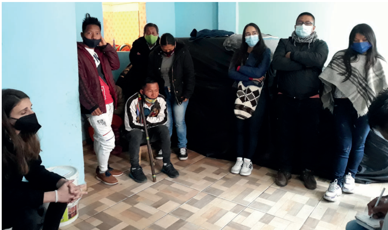
Visita en Ciudad Bolívar a la comunidad desplazada del pueblo indígena embera chami y embera katio. Bogotá D.C.

El gobierno distorsiona el objeto del acuerdo no que se refiere a los pueblos indígenas según las denuncias del CRIC: “El gobierno nacional, pese a la su postura poco disimulada de no cumplimiento de los acuerdos de L’Havana, logró centralizar gran parte de los recursos de cooperación internacional destinados al tema de la paz sin que dea las garantías necesarias para el desarrollo del acuerdo que garantice el cumplimiento efectivo de lo pactado. Entre otras partes de la agenda política gubernamental, se aprovechando de manera encubierta en supuestas iniciativas de paz y desarrollo, para usurpar el concepto de territorialidad desarrollada desde las comunidades indígenas, afrodescendientes y llanegües en sus planes de vida, y redefinió en función de la explotación económica de