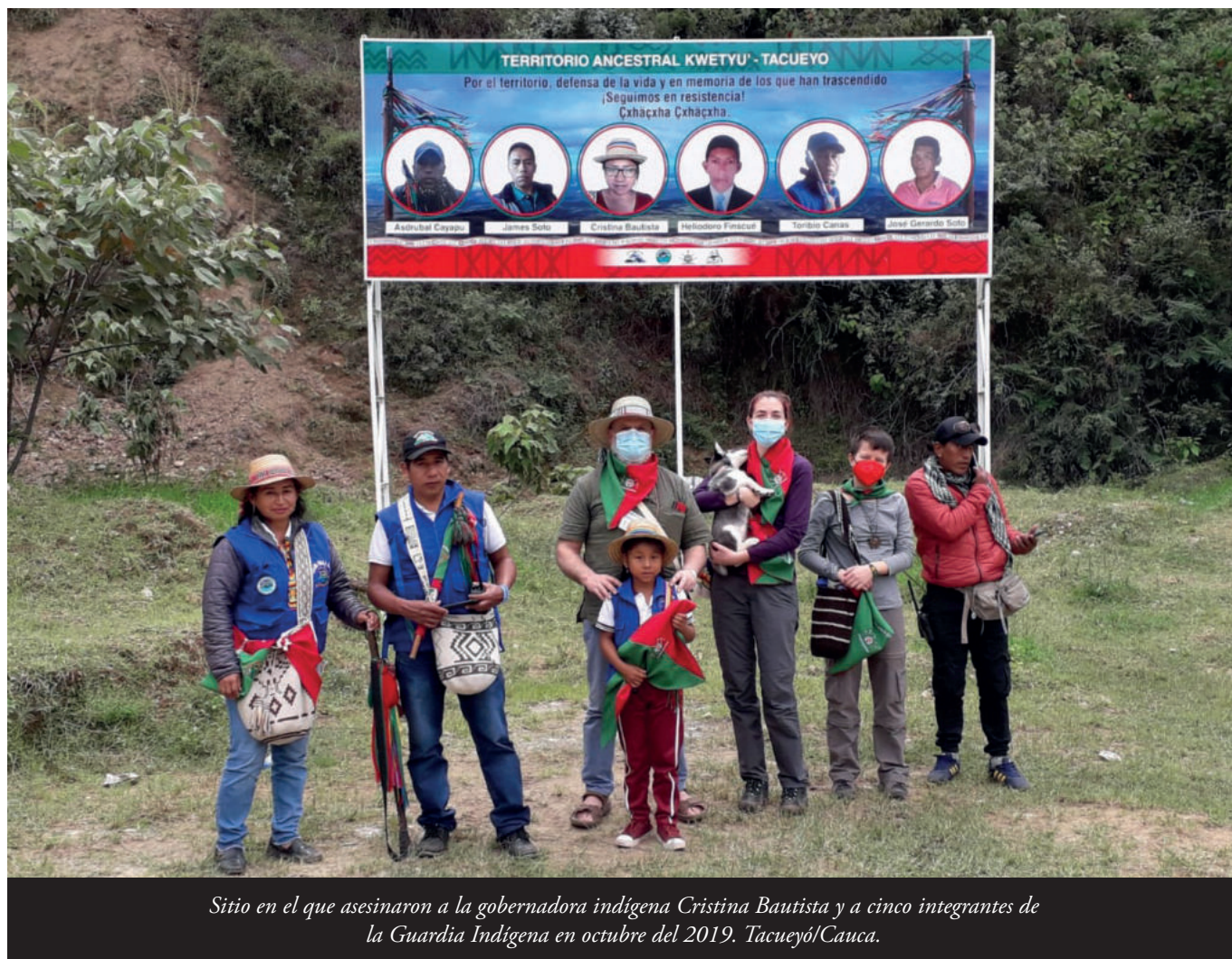
Sitio en el que asesinaron a la gobernadora indígena Cristina Bautista y a cinco integrantes de la Guardia Indígena en octubre del 2019. Tacueyó/Cauca.

sólu: “Tas nel barriu enquivocáu, equí nun aceptamos nada escontra la policía, esti ye un barriu de policíes pensionaos y activos.” 48