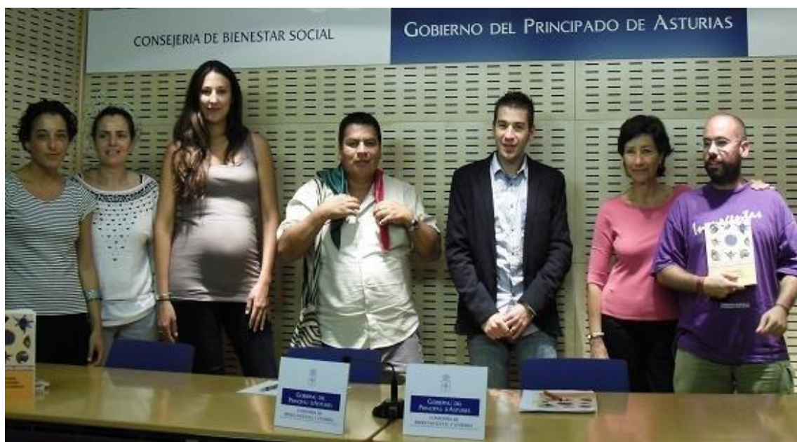
9 de agosto, diez años atrás: presentación de la Estrategia asturiana.