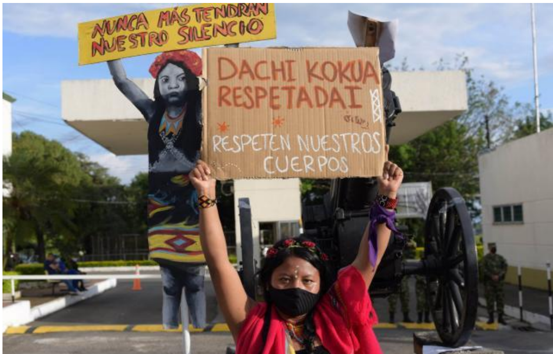
Protesta en el batallón por el secuestro y violación de una niña embera por militares en Risaralda.

Educadora, defensora y promotora de los derechos de las mujeres indígenas de la Costa Caribe de Nicaragua.