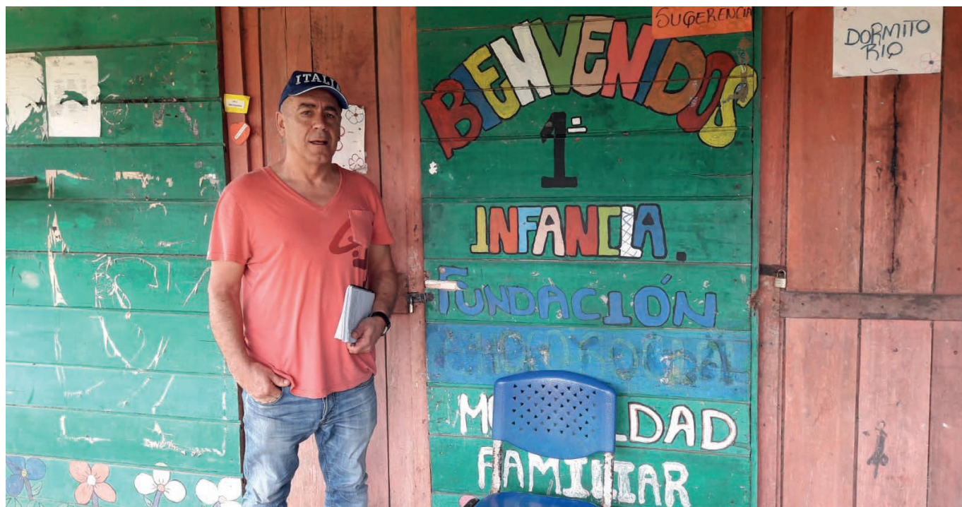
En el Chocó.