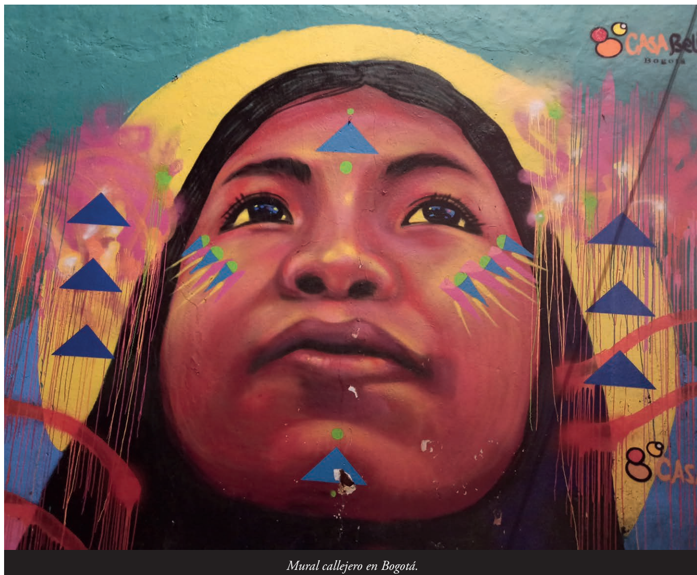
Mural callejero en Bogotá.

La probitú en Colombia –según les cifras oficiales– menguó ente'l 2002 y el 2015 al pasar del 49,7% al 27,8%, tendencia positiva que ta siendo contrarrestada pol crecimentu de la probitú absoluta (trece millones de persones), la resquebra urbano/rural, la diferencia ente les ciudades,