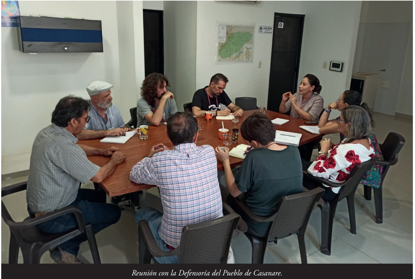
Reunión con la Defensoría del Pueblo de Casanare.

Les denuncies de la comunidá y de COSPACC indiquen qu'hai intereses económicos tres de la pretensión de desapolinar, pa lo que s'usaron métodos qu'ataquen a los drechos humanos y a la llegalidá colombiana: amenaces de quita-yos los neños a les families, acosáronlos, amenazáronlos, crimirarizáronlos y escluyóselos de les oportuni- daes d'emplegu.