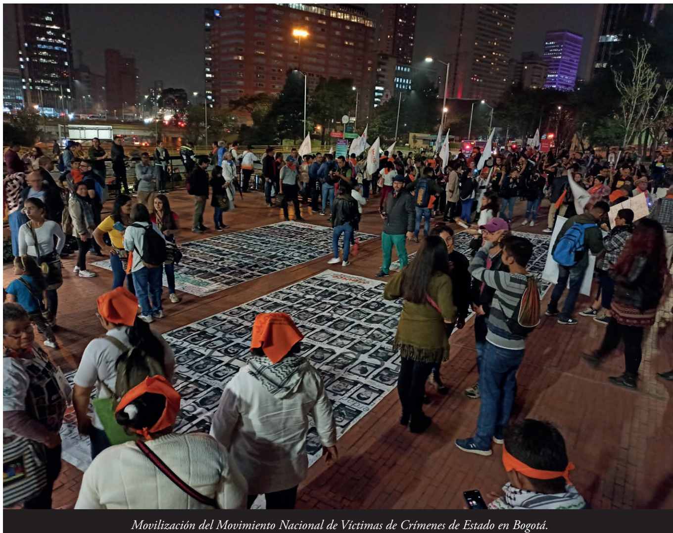
Movilización del Movimiento Nacional de Víctimas de Crímenes de Estado en Bogotá.

Ye un avance'l que la XEP, na busca de la verdá, la xusticia, la reparación y la non repetición, abriere siete macrocasos qu'escomiencen a investigase: casu 01, secuestro por parte de les FARC; casu 02, sobre la situación territorial de Ricaurte, Tumaco y Barbacoas; casu 03, sobre les execuciones estraxudiciales o 'falsos positivos'; casu 04, sobre la