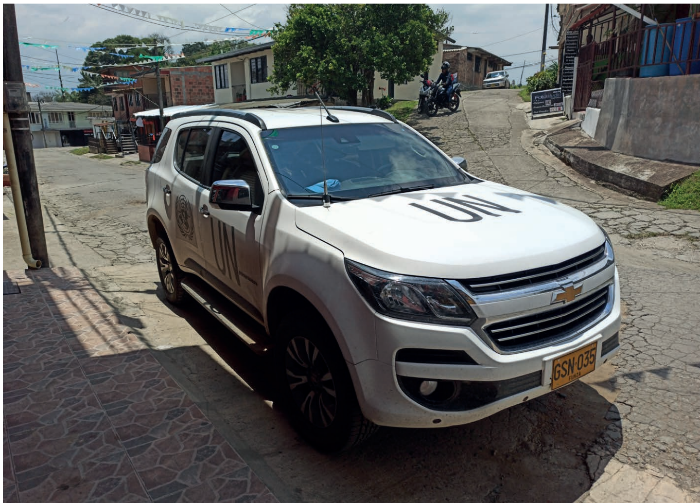
Vehículo de la ONU delante del local de la autoridad indígena en Morales, Cauca.

décades col consentimientu de la fuerza pública y del go- biernu. El control territorial y social de los paramilitares esoxiga de manera notable dende l'alcuertu de paz, más que nada nos territorios controlaos anteriormente poles FARC.