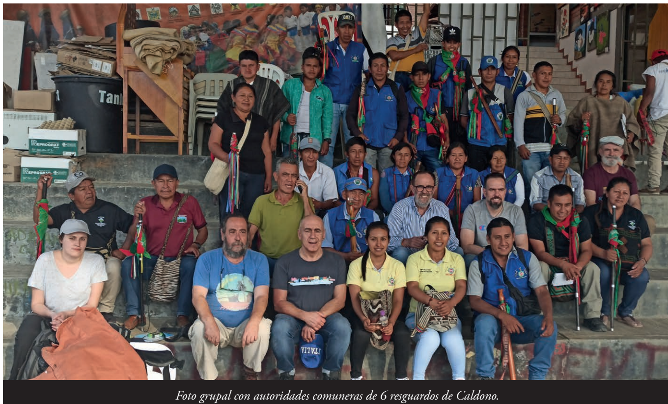
Foto grupal con autoridades comuneras de 6 resguardos de Caldoño.