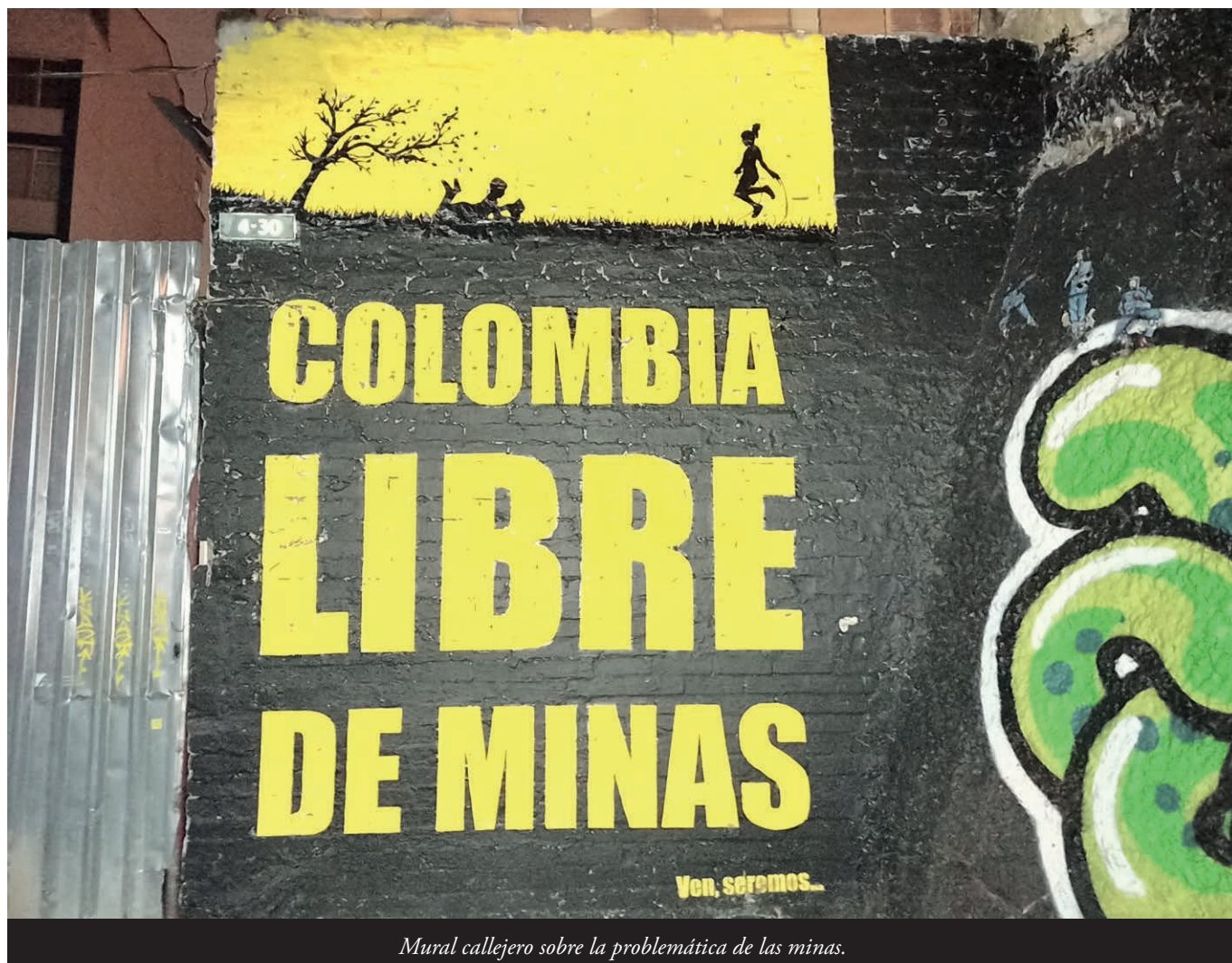
Mural callejero sobre la problemática de las minas.

blaciones frágiles, afectas n'emerxencias por movimientos y confinamientos, con impautu tamién en refuxaos y migrantes.