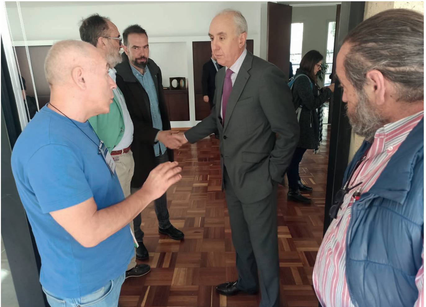
Charla de la Delegación Asturiana con el Embajador Español en Colombia.

“Ello ye que la terminación del conflictu del Estáu coles FARC dexó un panorama más grave que'l qu'había antes de los alcuerdos, mayormente polos incumplimientos a los ex-combatientes y colos compromisos en materia de reforma rural”. Audiencia pública pola vulneración de los drechos humanos. ONIC-ACIN, Toribío, Cauca, 5 d'agostu/2019