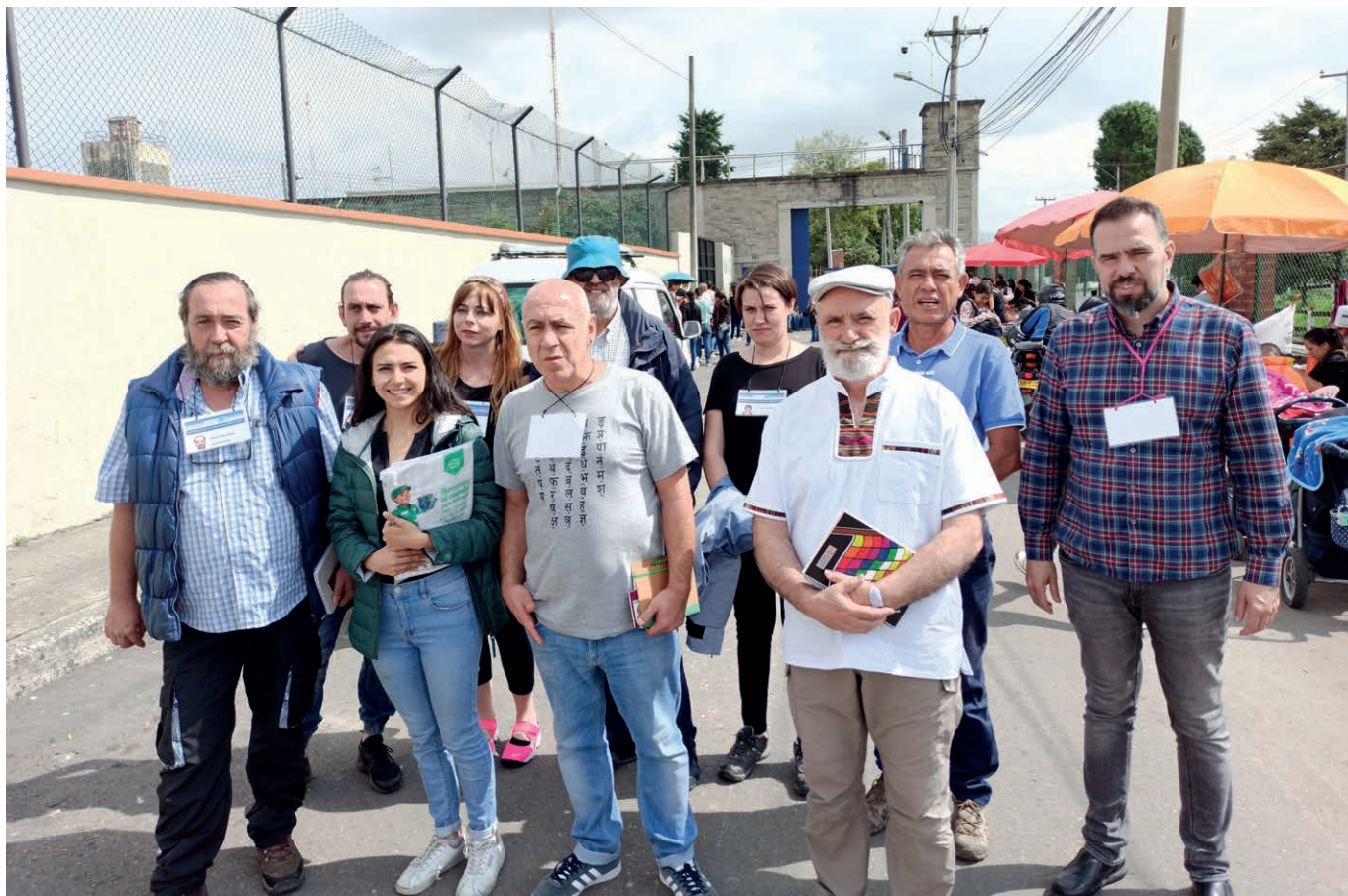
La Delegación Asturiana frente a la Cárcel El Buen Pastor.