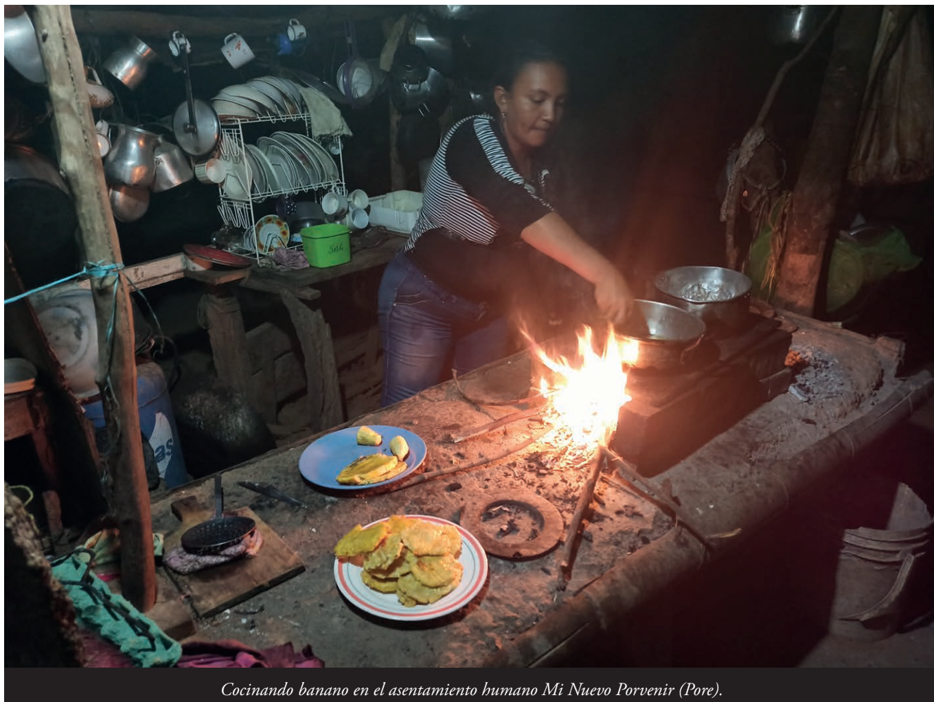
Cocinando banano en el asentamiento humano Mi Nuevo Porvenir (Pore).