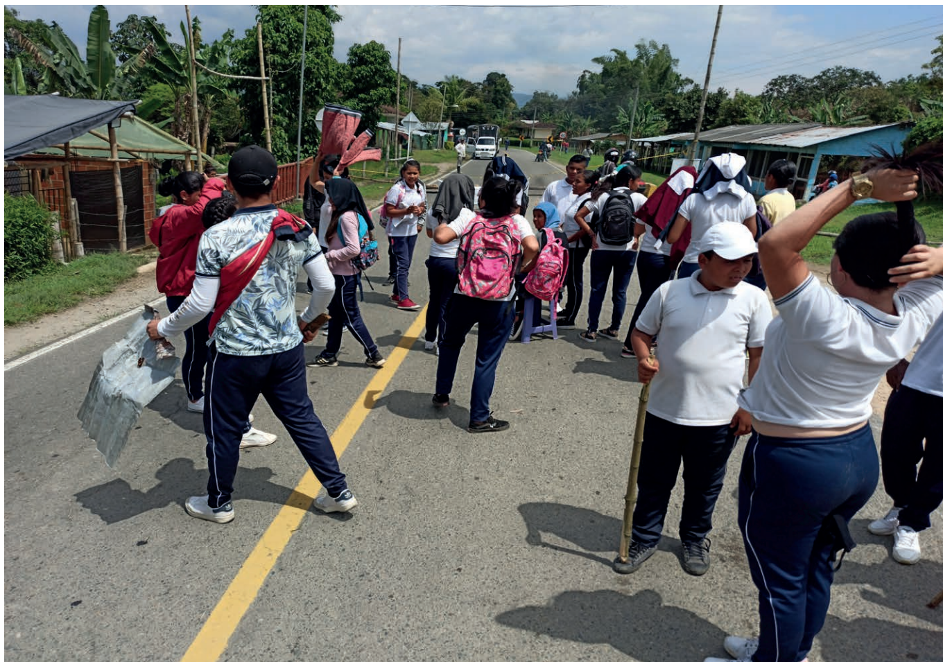
Estudiantes de secundaria realizando un corte de carretera para reclamar un profesor de inglés, tras 9 meses de demandar una solución a las instituciones colombiana sin lograrlo. La anterior profesora hubo de desplazarse por amenazas.

Nel añu pasáu repitióse l'usu arbitrariu de la fuercia y l'usu d'armes prohibíes escontra la población civil que causen muertes o mancadures oculares graves, aiciones delictives de la fuercia pública que les trata la xusticia militar p'asegurar la impunida gracias a la "solidarida de cuerpu".