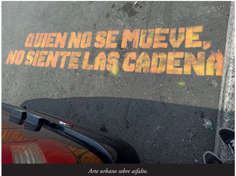
Arte urbano sobre asfalto.

Énte esta situación Amnistía Internacional espresó nun comunicáu del 23 de marzu/20 que: "Pa reducir