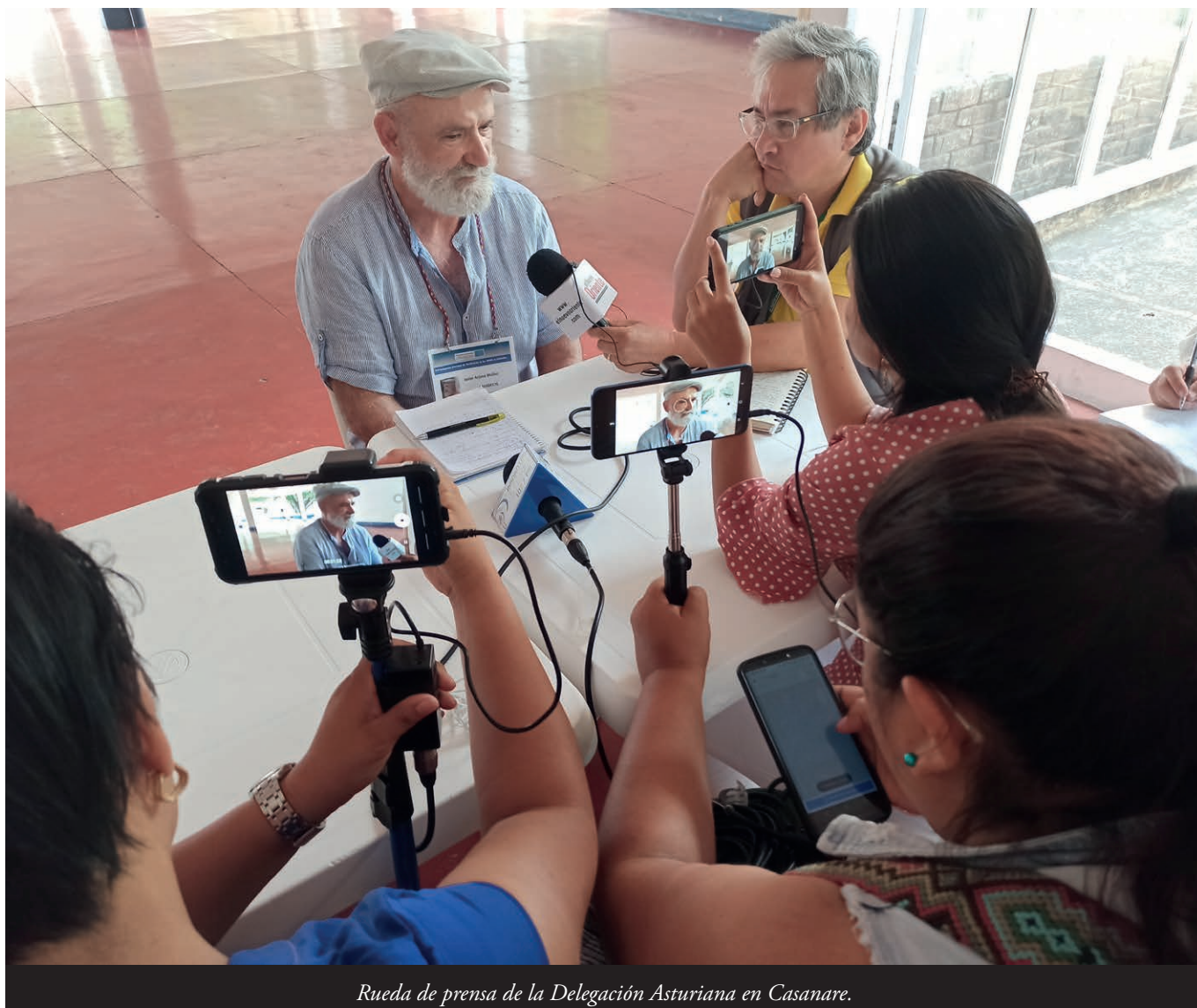
Rueda de prensa de la Delegación Asturiana en Casanare.

Gaitanistes de Colombia, AGC, y l'Exércitu de Lliberación Nacional, ELN, qu'amenacen y sometén a confinamientu a los integrantes de comunidaes que yá sufrieron per décadas amenaces, asesinatos, masacres, desapolinamientu de los