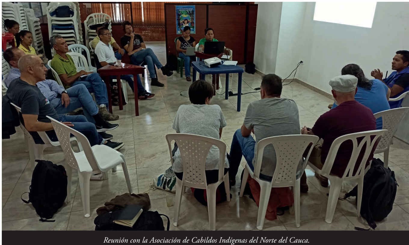
Reunión con la Asociación de Cabildos Indígenas del Norte del Cauca.

zándolos, presionándolos pa que s'armen o pa qu'aporten uniformes y armes. 29