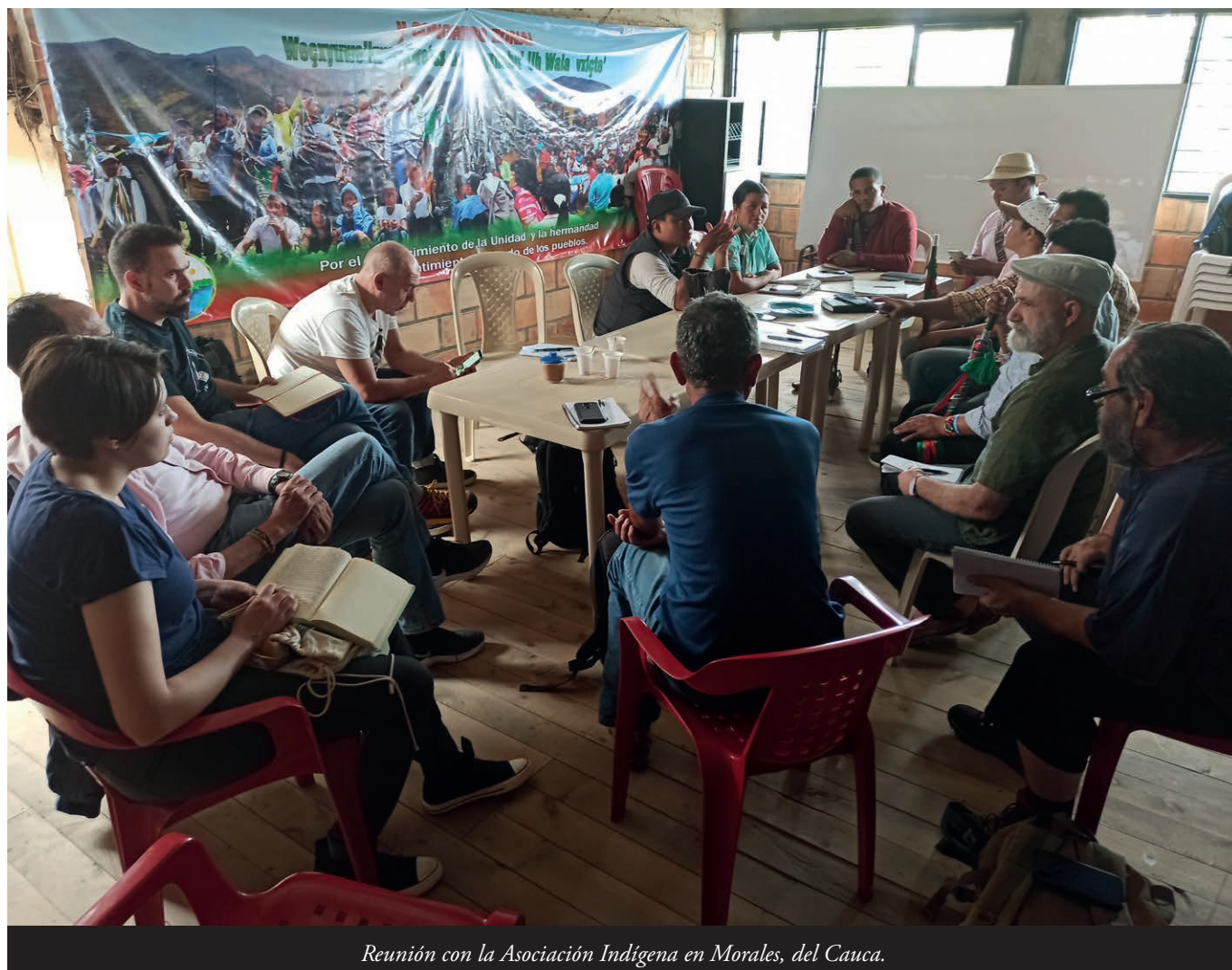
Reunión con la Asociación Indígena en Morales, del Cauca.

El gobiernu paralizó'l desmináu humanitariu en tol país, lo que ta afectando el mou de vida indíxena y esponiendo a la población civil a estos artefactos.