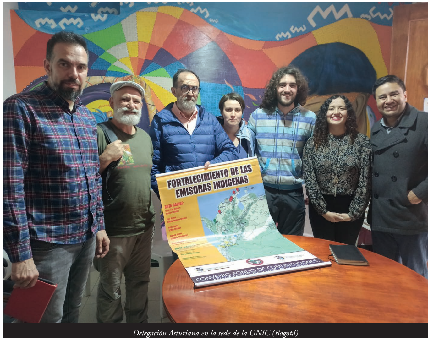
Delegación Asturiana en la sede de la ONIC (Bogotá).

riormente lleváronlu a la ESE CXAYUCE JXUT, onde recibió l'atención debida, pero, pola complexidá de les mancadures, hebo que lu mandar a otro nivel; llamentablemente morrió llegando al hospital Francisco de Paula en Santander de Quilichao; ellí, a pesar del procedimientu de reanimación realizáu pol equipu médicu, foi impo-