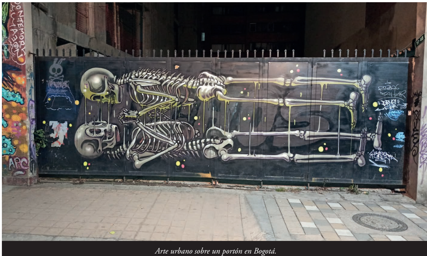
Arte urbano sobre un portón en Bogotá.

Universal de Drechos Humanos nun mundiu llibre de miu y miseria” 42 .