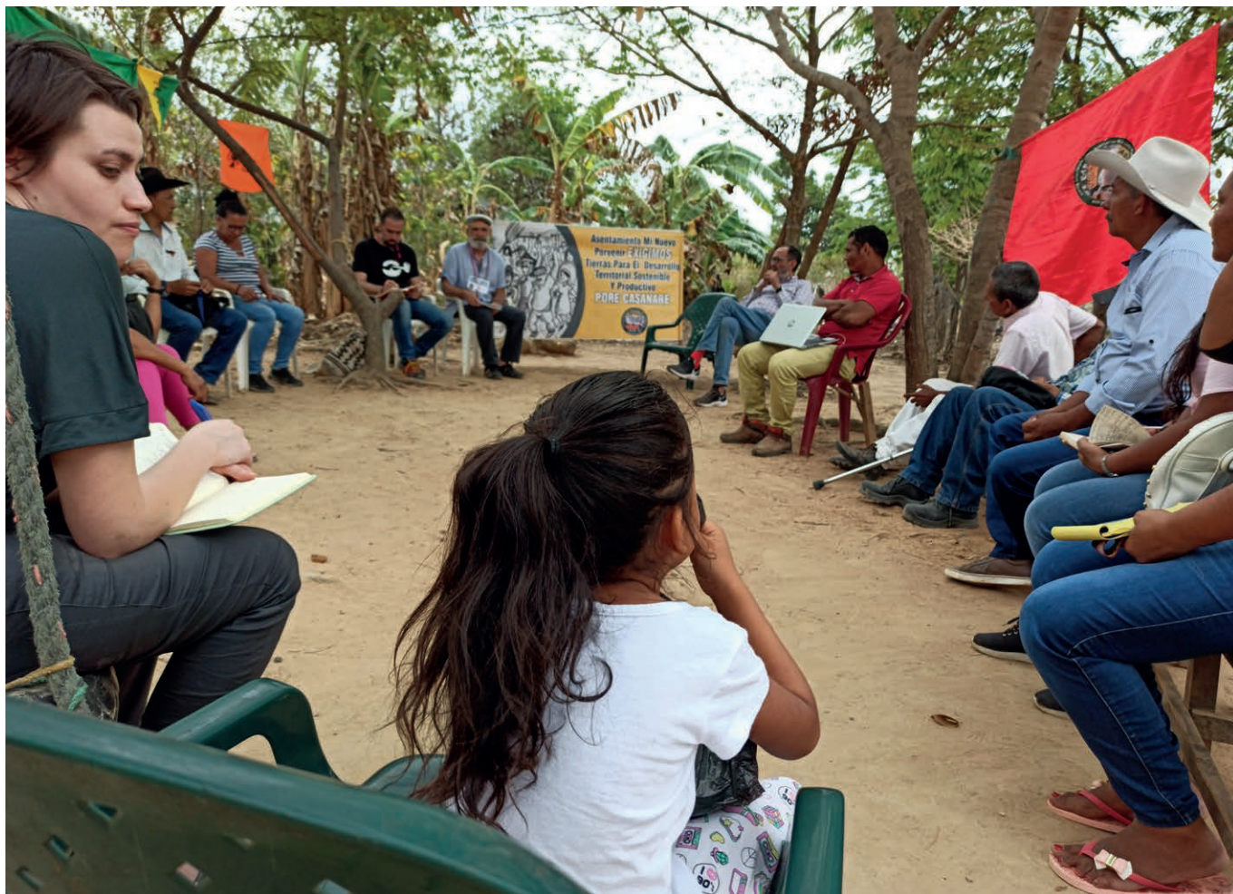
Una niña participa de la reunión con la Delegación Asturiana en el asentamiento humano Mi Nuevo Porvenir (Pore).