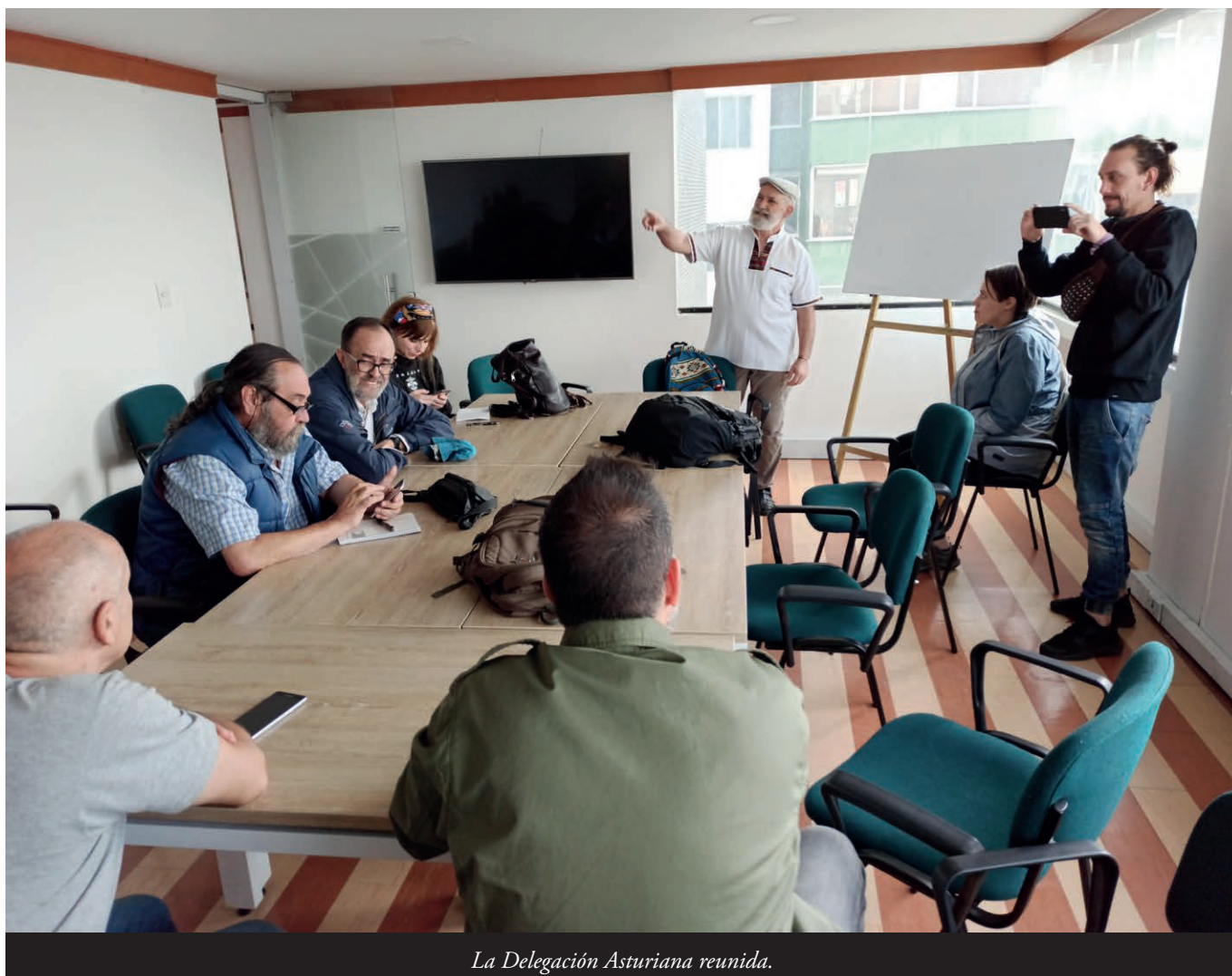
La Delegación Asturiana reunida.