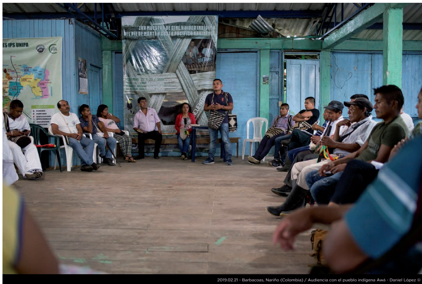
2019.02.21 - Barbacoas, Nariño (Colombia) / Audiencia con el pueblo indígena Awá

ta empantanada porque la fiscalía nun permite'l tratamientu penal diferencial pa los llabradores cultivadores y muyeres probes, y porque nun hai formalización de la propiedá de la tierra nin proyectos económicos alternativos... L'Alcuerdu tuvo una falla estructural que pesa como pirámide exipcia: que se firmó primero la dexación d'armes ensin tener acordao enantes los términos de la reincorporación económica y social de los guerrilleros". 5