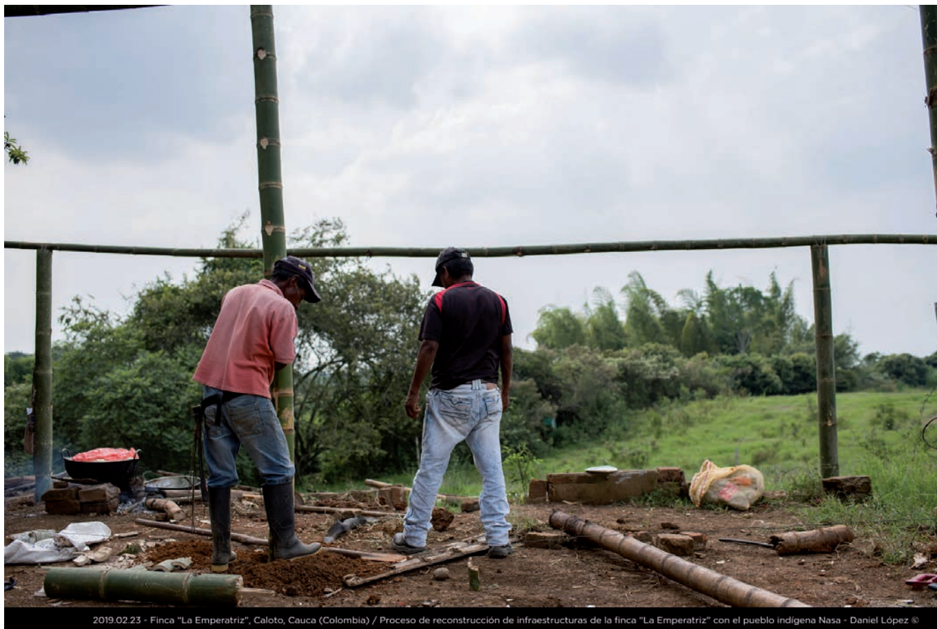
2019.02.23 · Finca "La Emperatriz", Caloto, Cauca (Colombia) / Proceso de reconstrucción de infraestructuras de la finca "La Emperatriz" con el pueblo indígena Nasa ·

“En Tumaco hubo más de doscientos personas asesinadas en 2017 y otras tantas en 2018. Hai más de diez grupos armados al marxe de la llei exerciendo la violencia en barrios como Nuevo Milenio y Playa Baja. L'añu pasáu alcontróse un cilindru-bomba enterráu nun campu deportivu infantil, nenguna autoridá quixo desactivalu, los neños esploráronlu y contenía esplosivos”. 22