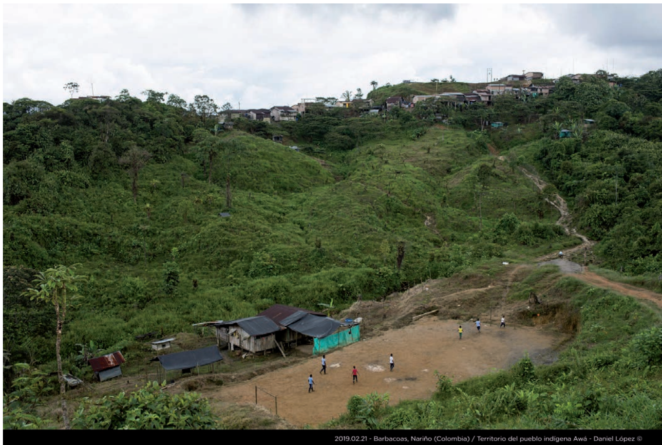
2019.02.21 - Barbaocoas, Nariño (Colombia) / Territorio del pueblo indígena Awá