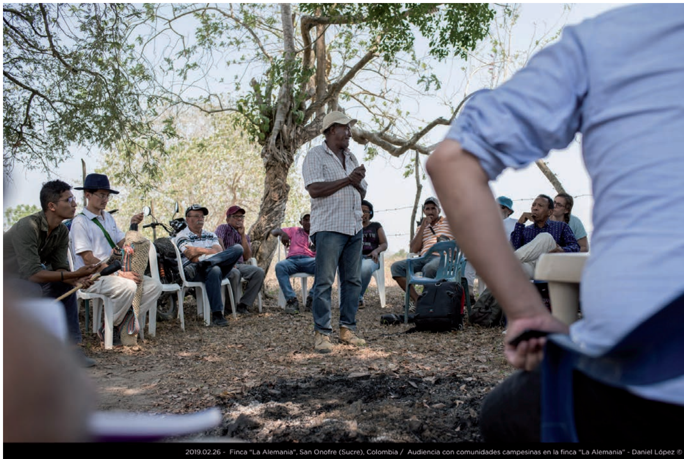
2019.02.26 - Finca "La Alemania", San Onofre (Sucre), Colombia / Audiencia con comunidades campesinas en la finca "La Alemania"