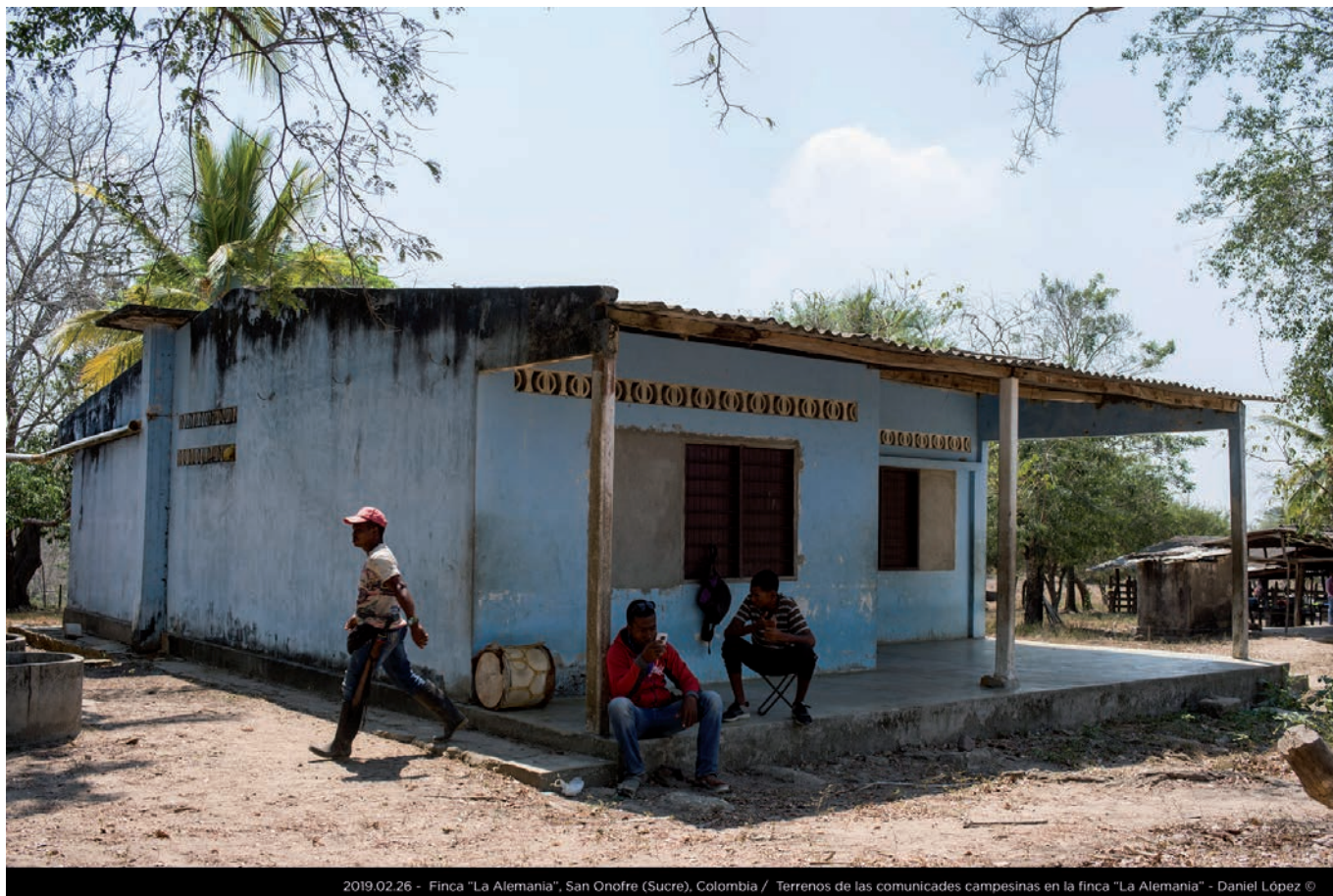
2019.02.26 - Finca "La Alemania", San Onofre (Sucre), Colombia / Terrenos de las comunicades campesinas en la finca "La Alemania"