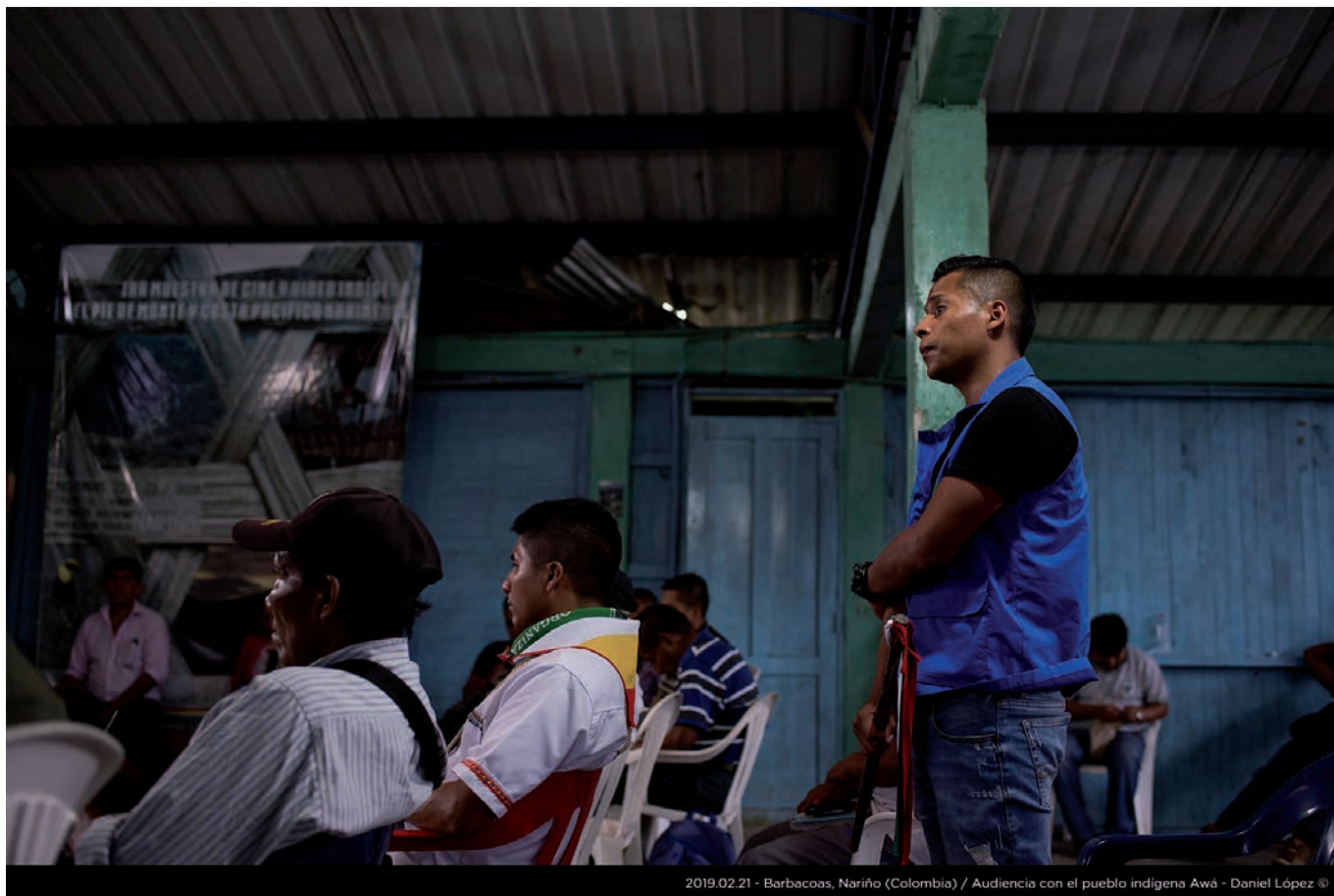
2019.02.21 - Barbacoas, Nariño (Colombia) / Audiencia con el pueblo indígena Awá

del Estáu. Pa dalgunos, retomar les armes foi la única opción”. 6