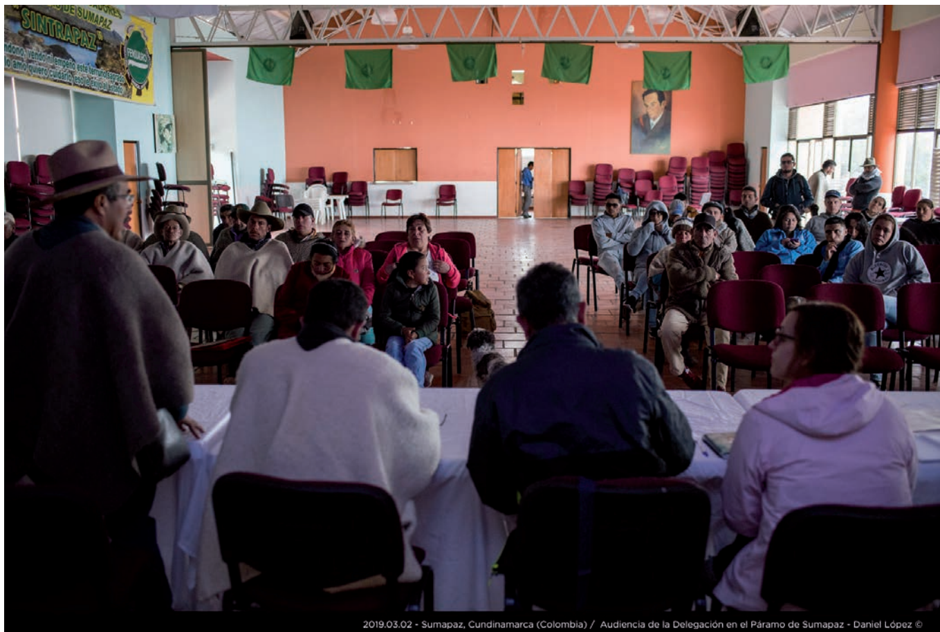
2019.03.02 - Sumapaz, Cundinamarca (Colombia) / Audiencia de la Delegación en el Páramo de Sumapaz