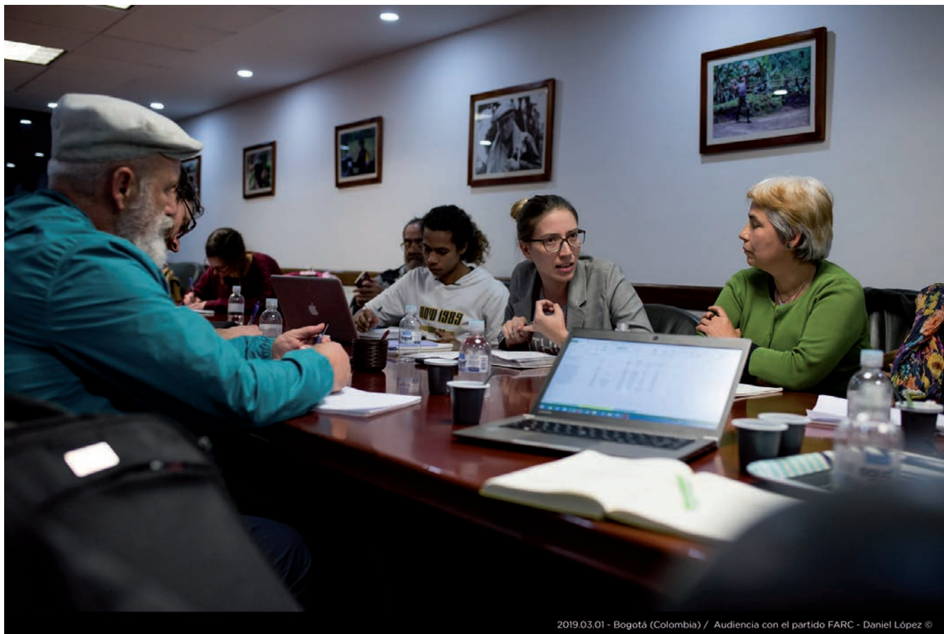
2019.03.01 - Bogotá (Colombia) / Audiencia con el partido FARC