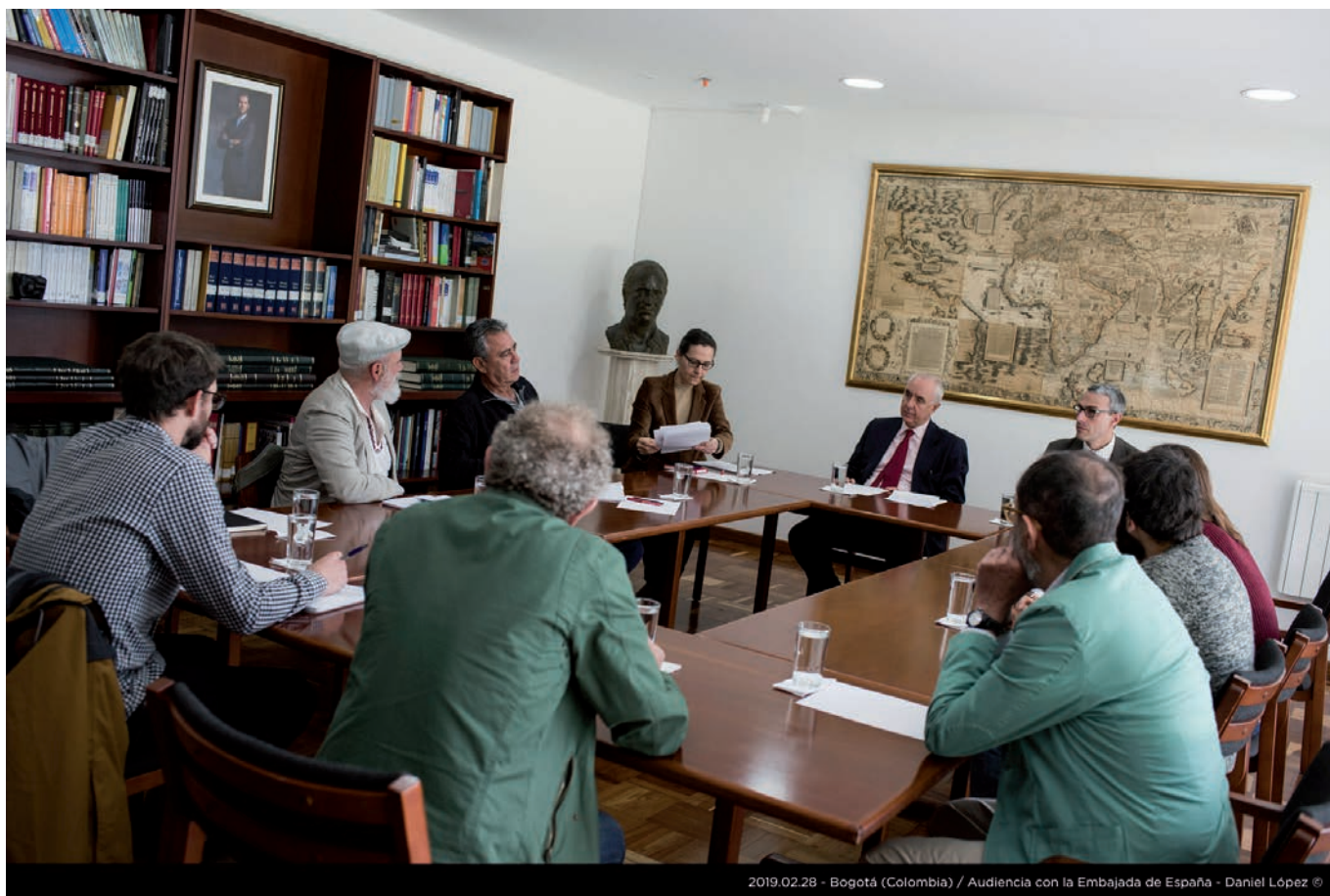
2019.02.28 - Bogotá (Colombia) / Audiencia con la Embajada de España