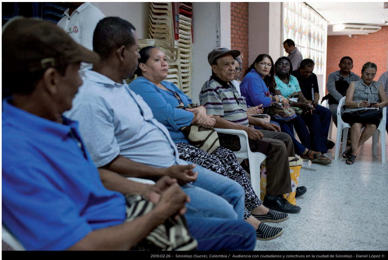
2019.02.26 - Sincelejo (Sucre), Colombia / Audiencia con ciudadanos y colectivos en la ciudad de Sincelejo

ellos y nun se pue denunciar, porque nin la policía nin la fiscalía reciben quexes contra paramilitares o narcos”. 53