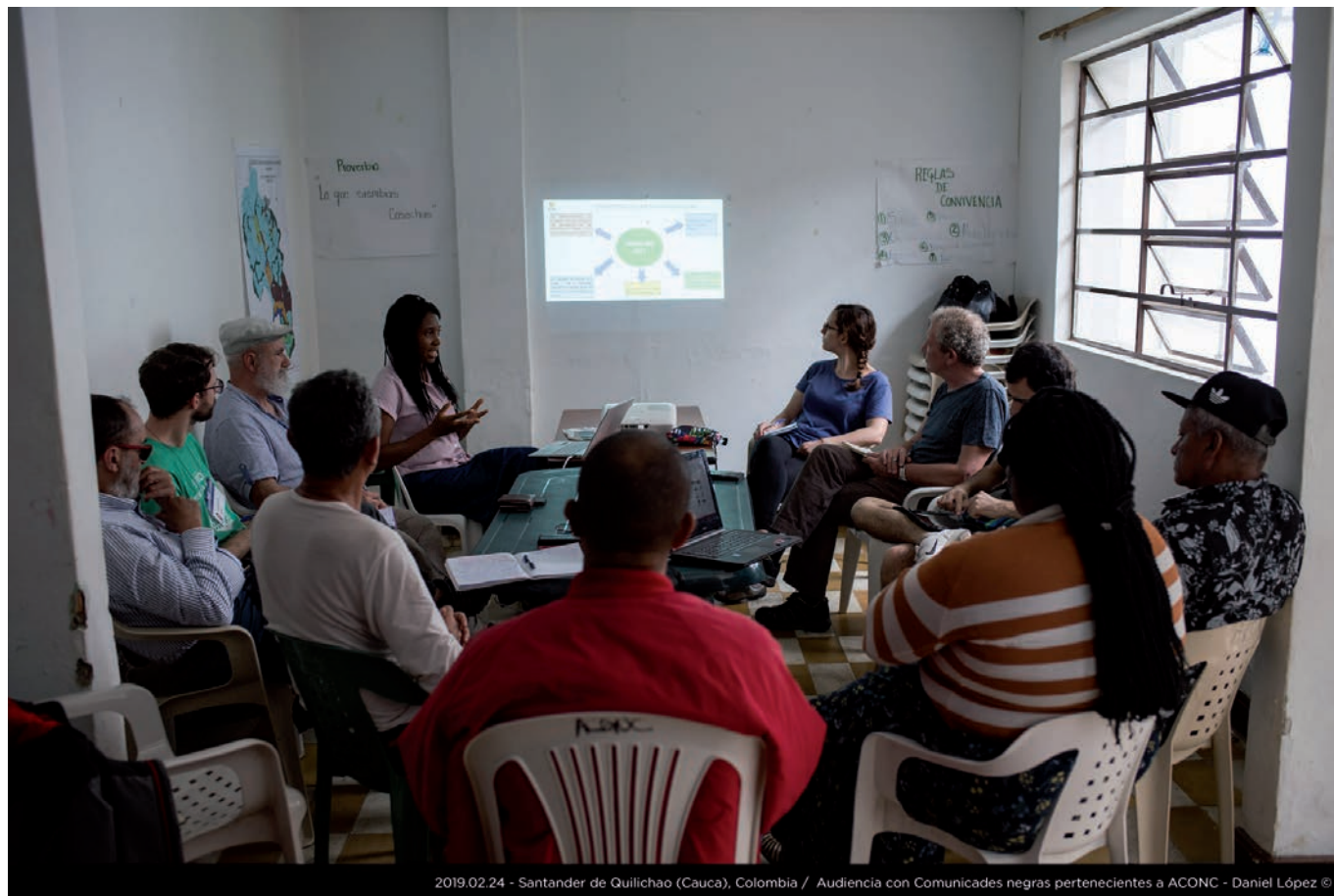
2019.02.24 - Santander de Quilichao (Cauca), Colombia / Audiencia con Comunicades negras pertenecientes a ACONC