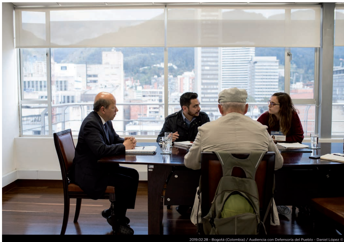
2019.02.28 - Bogotá (Colombia) / Audiencia con Defensoría del Pueblo

“Dende'l Conseyu Comunitariu Los Amigos, pidimos la devolución de los nuestros territorios, pero nun hai presupuestu del gobiernu para devolvemos nin pa comprar tierras nuevas. Tamos abandonaos”. 77