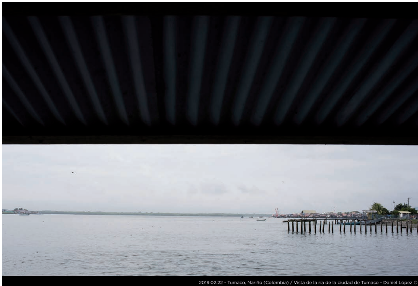
2019.02.22 - Tumaco, Nariño (Colombia) / Vista de la ría de la ciudad de Tumaco

Colombia vive graves retrocesos en Derechos Humanos y la aplicación del Derecho Internacional Humanitario (DIH), con responsabilidad directa del gobierno de Iván Duque Escobar.