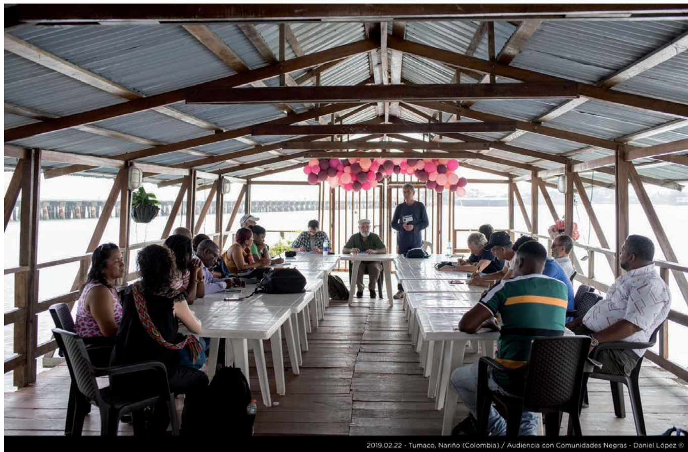
2019.02.22 - Tumaco, Nariño (Colombia) / Audiencia con Comunidades Negras

sigue siendo una herramienta política y económica del Estáu colombianu.