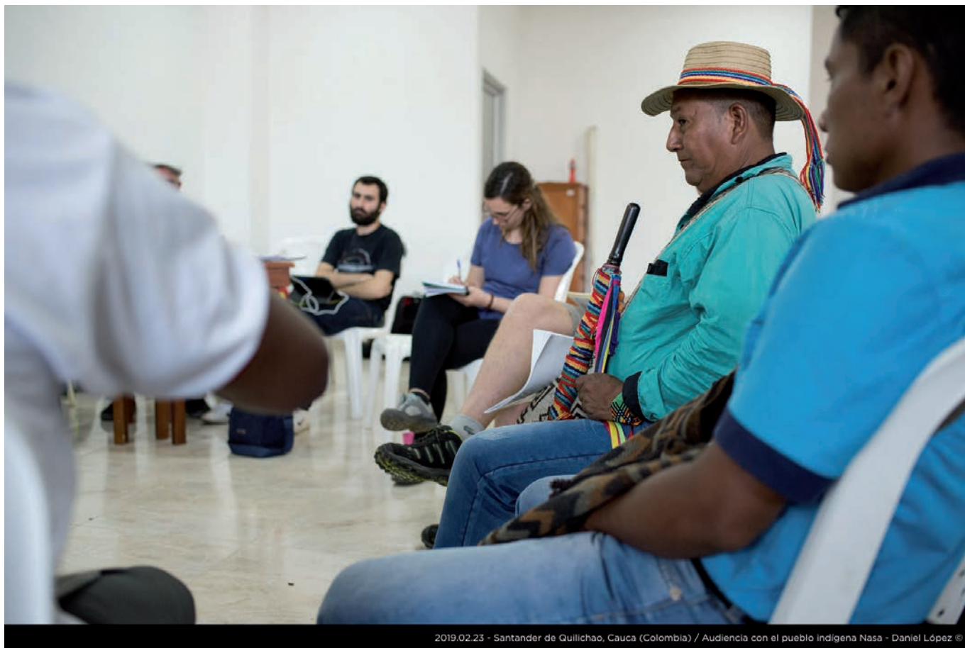
2019.02.23 - Santander de Quilichao, Cauca (Colombia) / Audiencia con el pueblo indígena Nasa

portadores de la llingua ancestral y atránquense nes cases, nun pesquen, nun puen salir y necesitan acompañamientu pues son les que tresmiten la cultura, l'idioma awá". 19