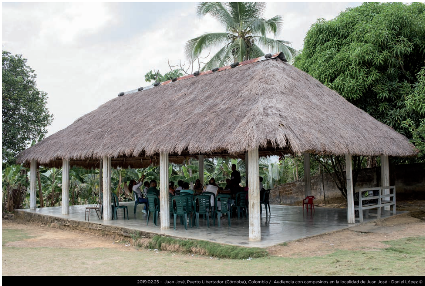
2019.02.25 - Juan José, Puerto Libertador (Córdoba), Colombia / Audiencia con campesinos en la localidad de Juan José

ción. El conflictu armáu agrávase énte los güeyos indiferentes del gobiernu saliente y el silenciú cómpliz del gobiernu electu”. 36