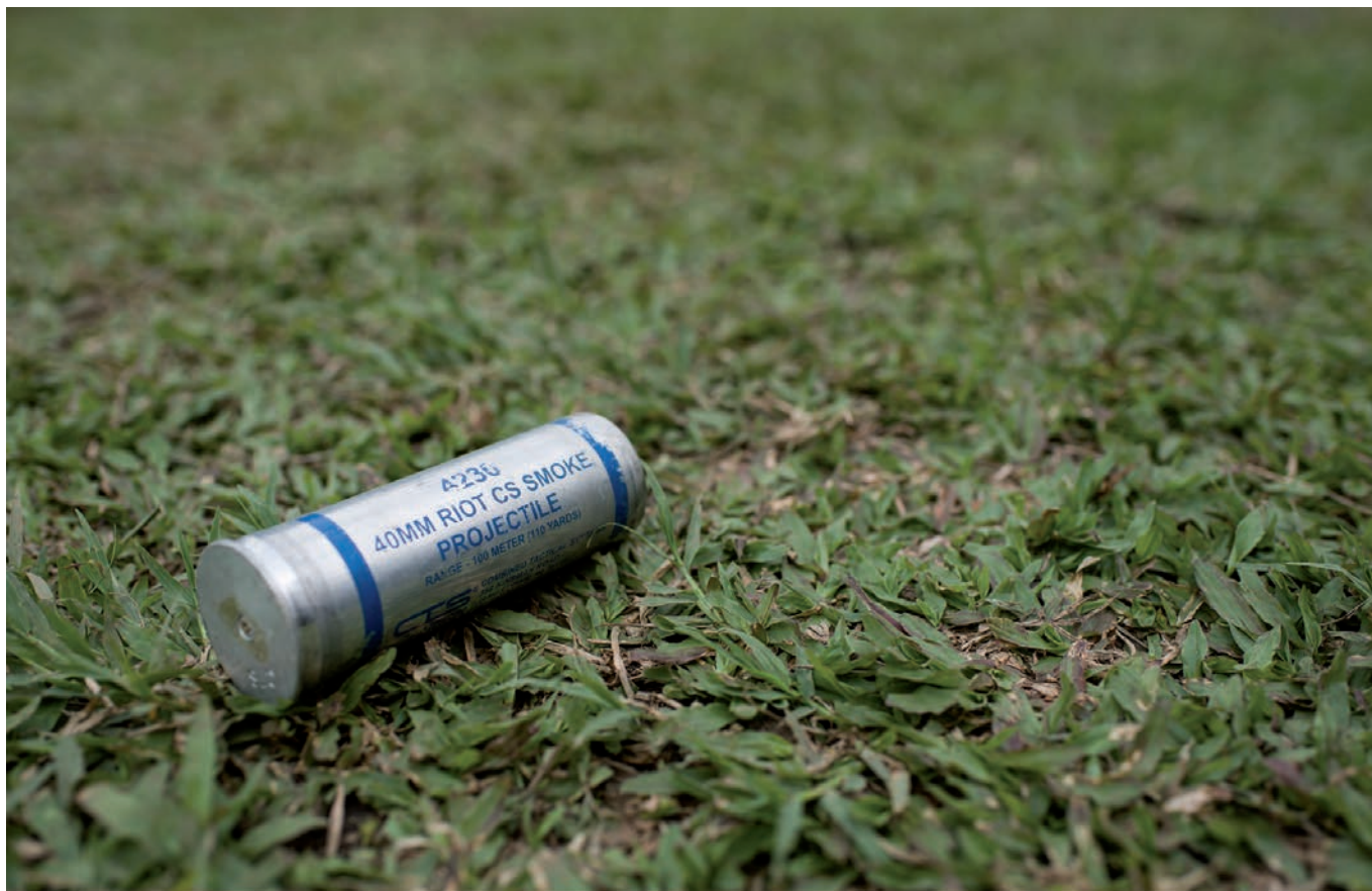
2019.02.23 - Caloto (Cauca), Colombia / Restos de la munición usada contra el pueblo indígena Nasa en la finca "La Emperatriz"

guardu y hai campos minaos. Nun tamos con nengún bandu, pero atáquenmos toos. El gobiernu juega a dividir pa que mos enfrentemos indíxenes contra afros poles tierras, pa evitalo creamos un Conseyu Inter étnicu”. 24