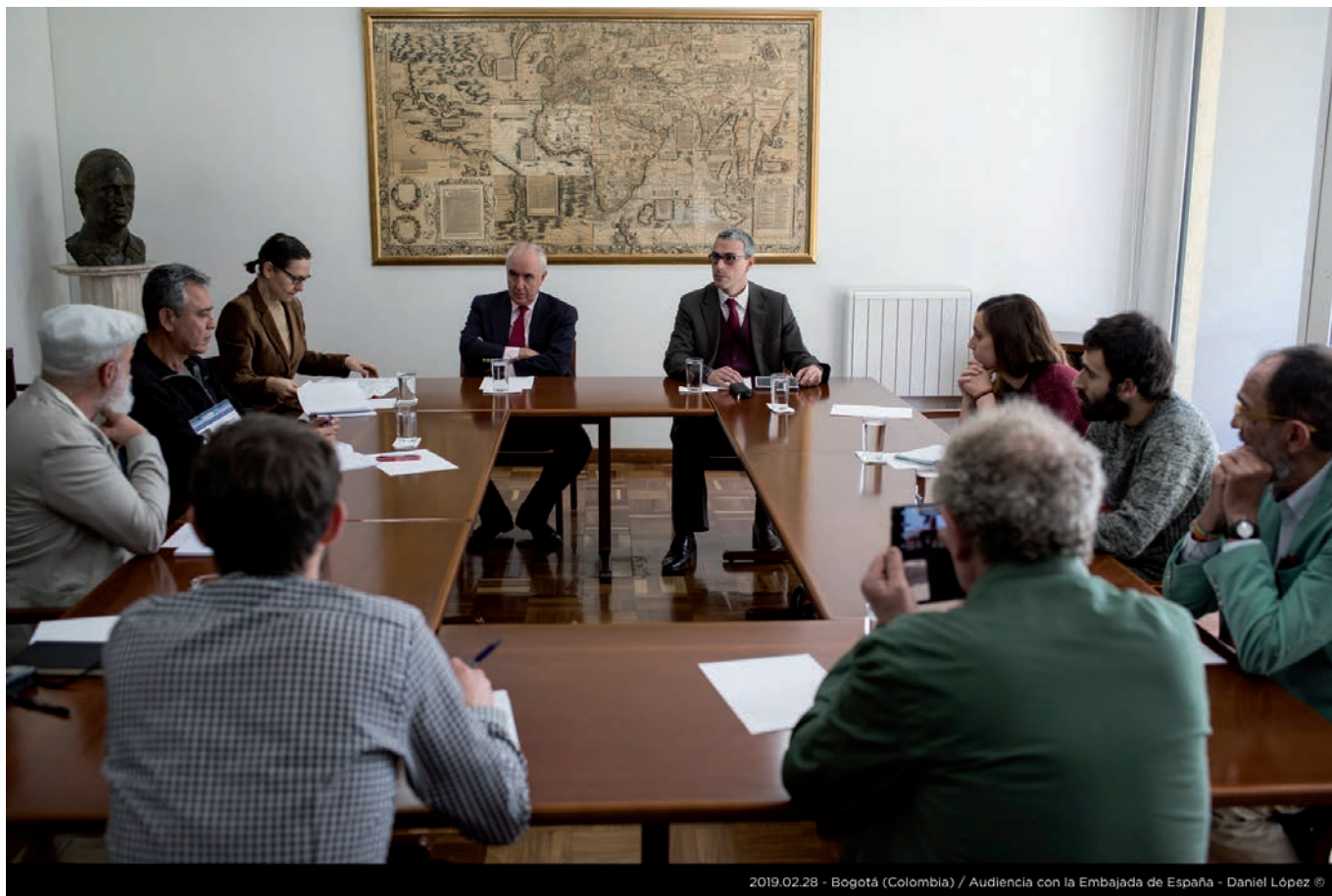
2019.02.28 - Bogotá (Colombia) / Audiencia con la Embajada de España