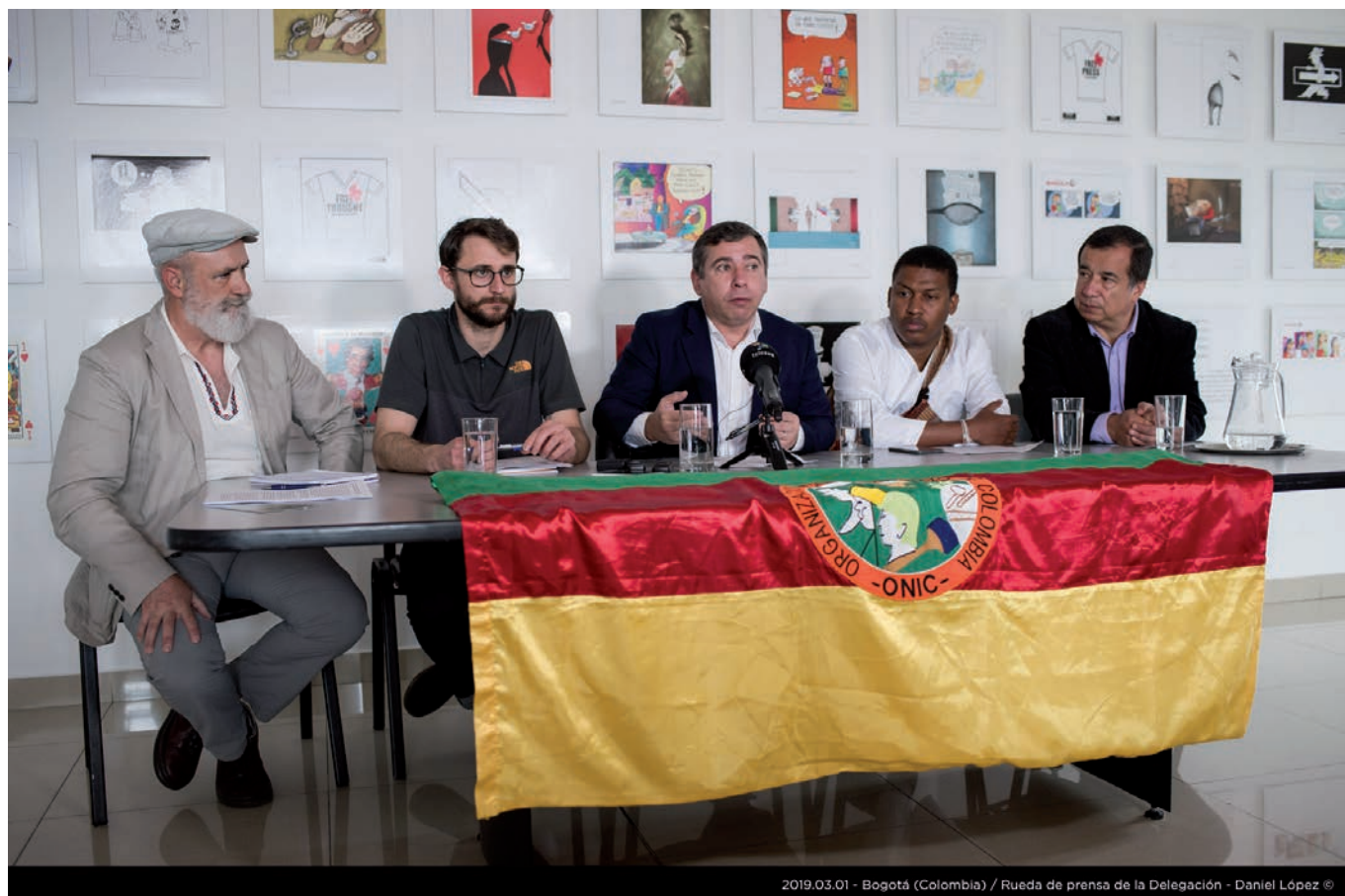
2019.03.01 - Bogotá (Colombia) / Rueda de prensa de la Delegación