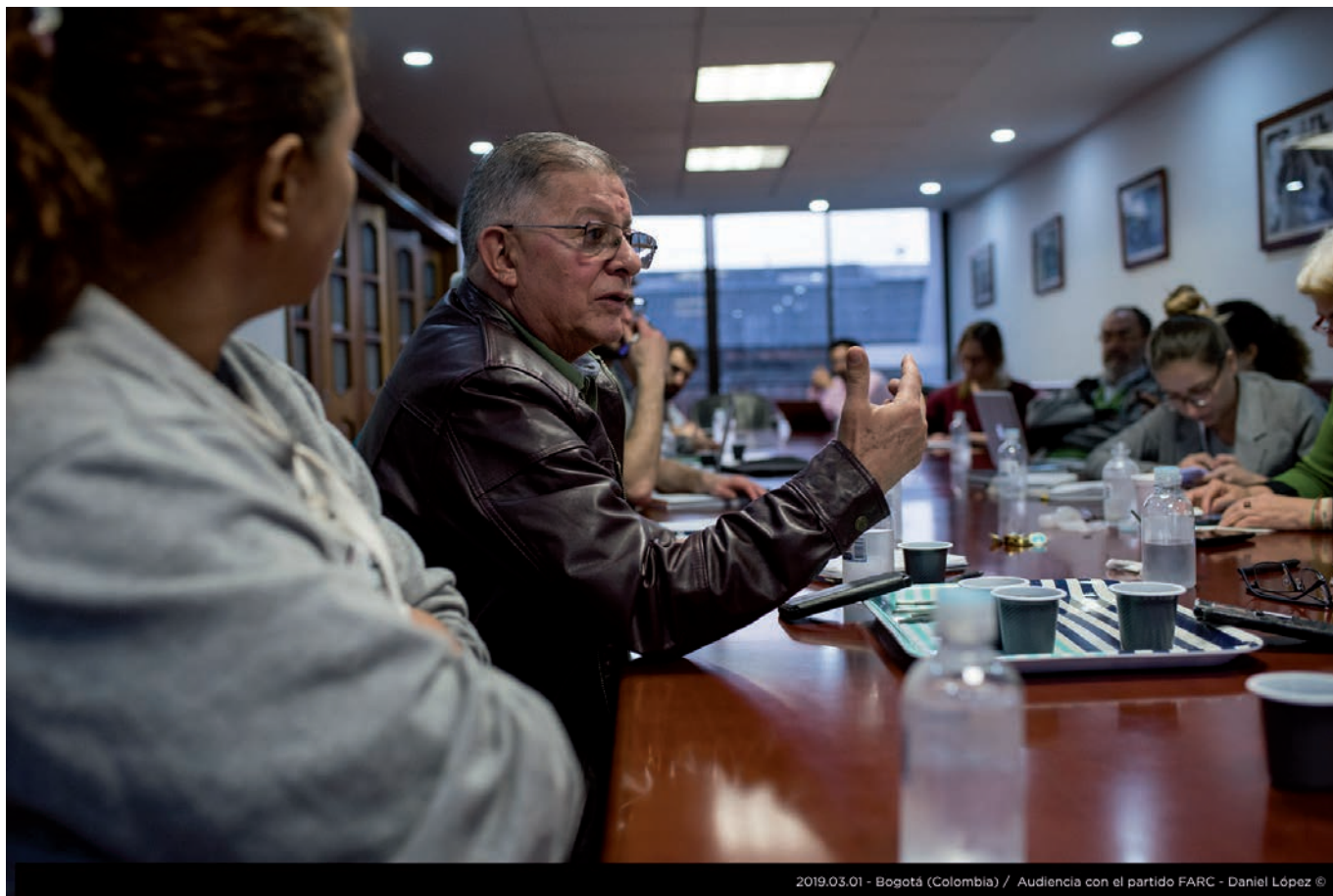
2019.03.01 - Bogotá (Colombia) / Audiencia con el partido FARC